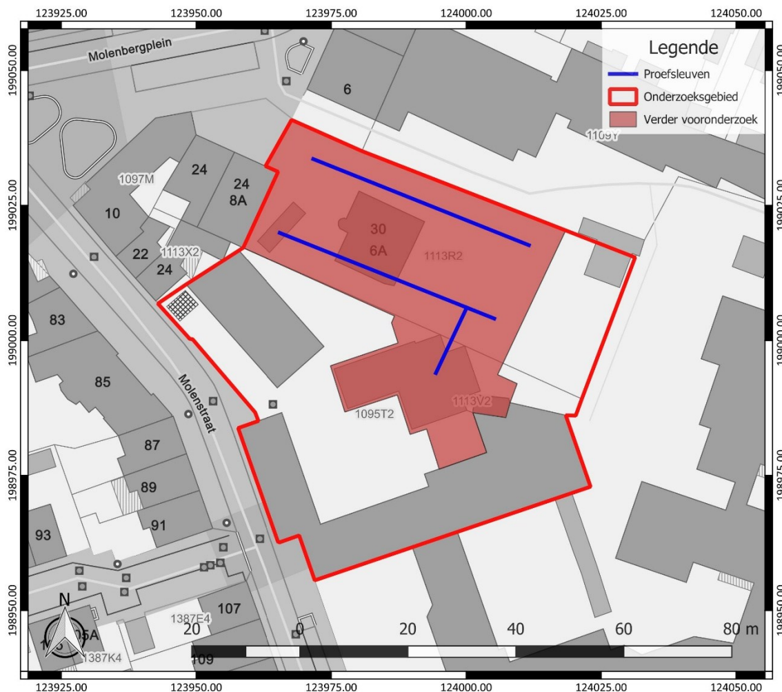
Figuur 4: Inplanting van de proefsleuven (blauw), binnen het onderzoeksgebied (rood), weergegeven op het GRB (www.geopunt.be)

Voor de gehanteerde onderzoekstechnieken is hoofdstuk 8.6 van de Code van Goede Praktijk van toepassing. Er wordt gewerkt met continue, parallelle proefsleuven. In dat geval heeft het gebruik van 2 m brede sleuven met een tussenafstand van 15 m een hogere trefkans dan 4 m brede sleuven met een tussenafstand van 20 m. 1 De aangelegde proefsleuven dienen een breedte van 2 m te hebben.