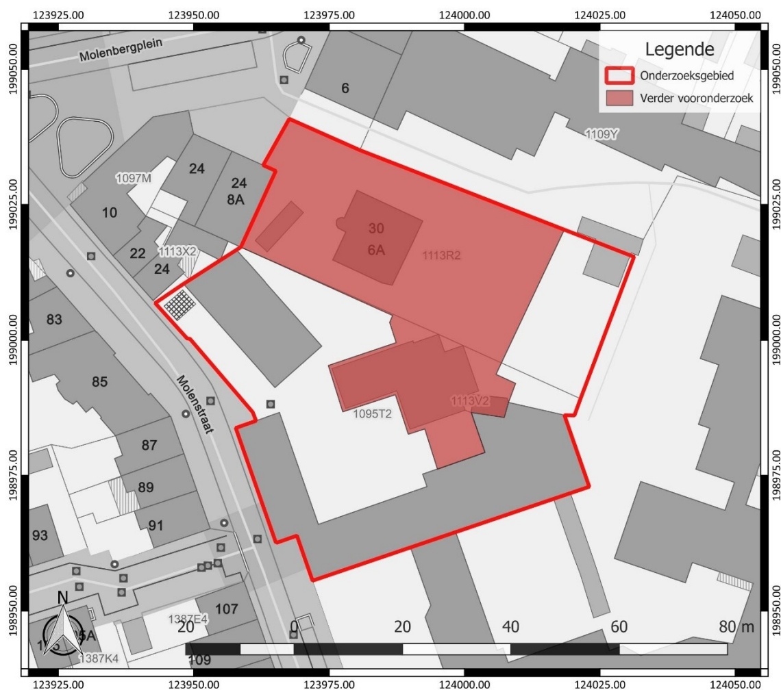
Figuur 2: Zone afgebakend voor verder vooronderzoek, weergegeven op het GRB ( www.geopunt.be )

De onderzoeksdoelen zijn succesvol bereikt wanneer de vooropgestelde onderzoeksvragen en de bijkomende onderzoeksvragen die opgesteld worden naar aanleiding van elk assessment beantwoord zijn.