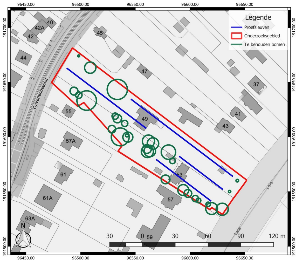
Figuur 4: Inplanting van de proefsleuven (blauw), binnen het onderzoeksgebied (rood), weergegeven op het GRB ( www.geopunt.be )

De proefsleuven hebben een maximale tussenafstand van middelpunt tot middelpunt van 15 m. De beoogde oppervlakte die onderzocht dient te worden door middel van proefsleuven, bedraagt minimaal 10 %. Dit wordt niet behaald aan de hand van het vooropgestelde sleuvenplan, dat voorziet in 316 lopende m proefsleuven. Dit resulteert in een onderzocht aandeel van 7,56 %. Het niet behalen van de vooropgestelde 10 % is een gevolg van de aanwezige, te behouden bomen. Er mag niet gegraven worden onder de kroonprojectie van de te behouden bomen, omdat dit schade aan het wortelgestel kan veroorzaken.