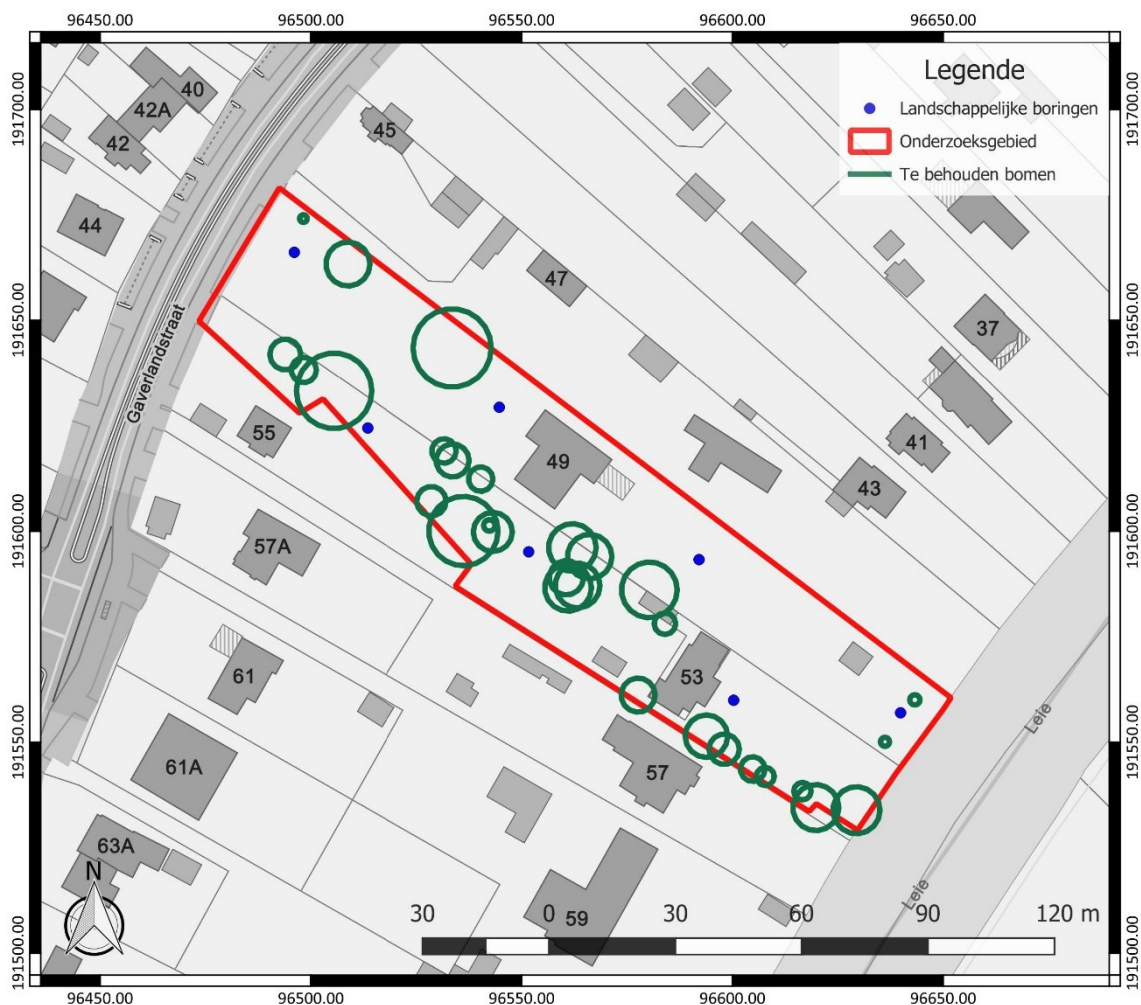
Figuur 3: Inplanting van de landschappelijke boringen (blauw), binnen het onderzoeksgebied (rood), weergegeven op het GRB ( www.geopunt.be )

Voor de gehanteerde onderzoekstechnieken is hoofdstuk 7.3 van de Code van Goede Praktijk van toepassing. De boringen worden gezet volgens een verspringend driehoeksgrid van 30 x 40 m, waarbij 30 m de afstand is tussen de raaien en 40 m de afstand tussen de boringen op een raai. De boringen worden gezet met een Edelmanboor van 7 cm in diameter. Dit volstaat om een beeld te krijgen van de bodemopbouw binnen het onderzoeksgebied en de mogelijke landschappelijke verschillen op microschaal.