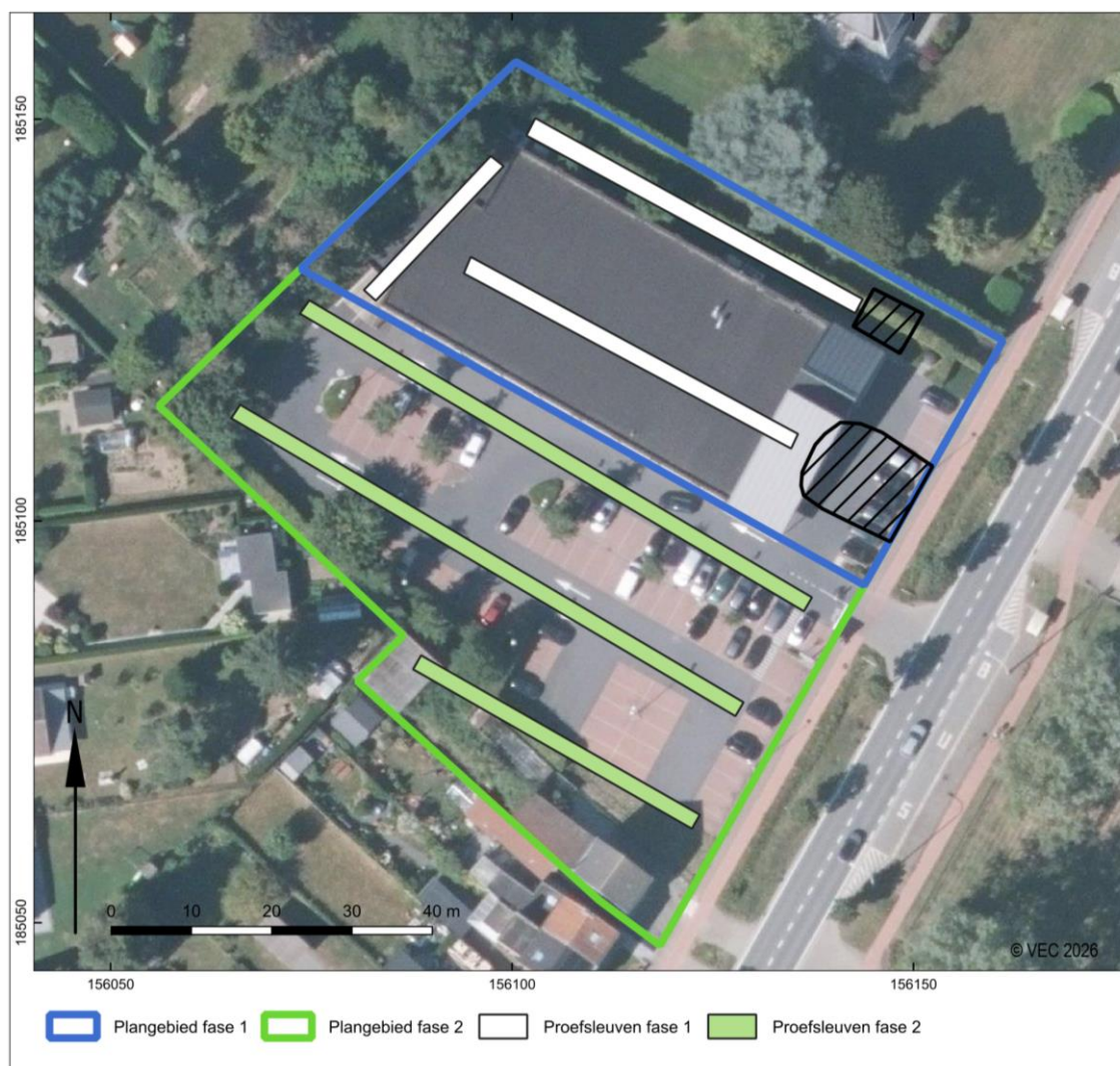
Figuur 3: Fasering van het onderzoek en proefsleuven voorstel voor fase 2.

Voor de zone van fase 2 is het programma van maatregelen bij de archeologienota (OE-id 30051) nog leidend. Hier zal nog een proefsleuvenonderzoek moeten worden uitgevoerd, zie figuur 4.