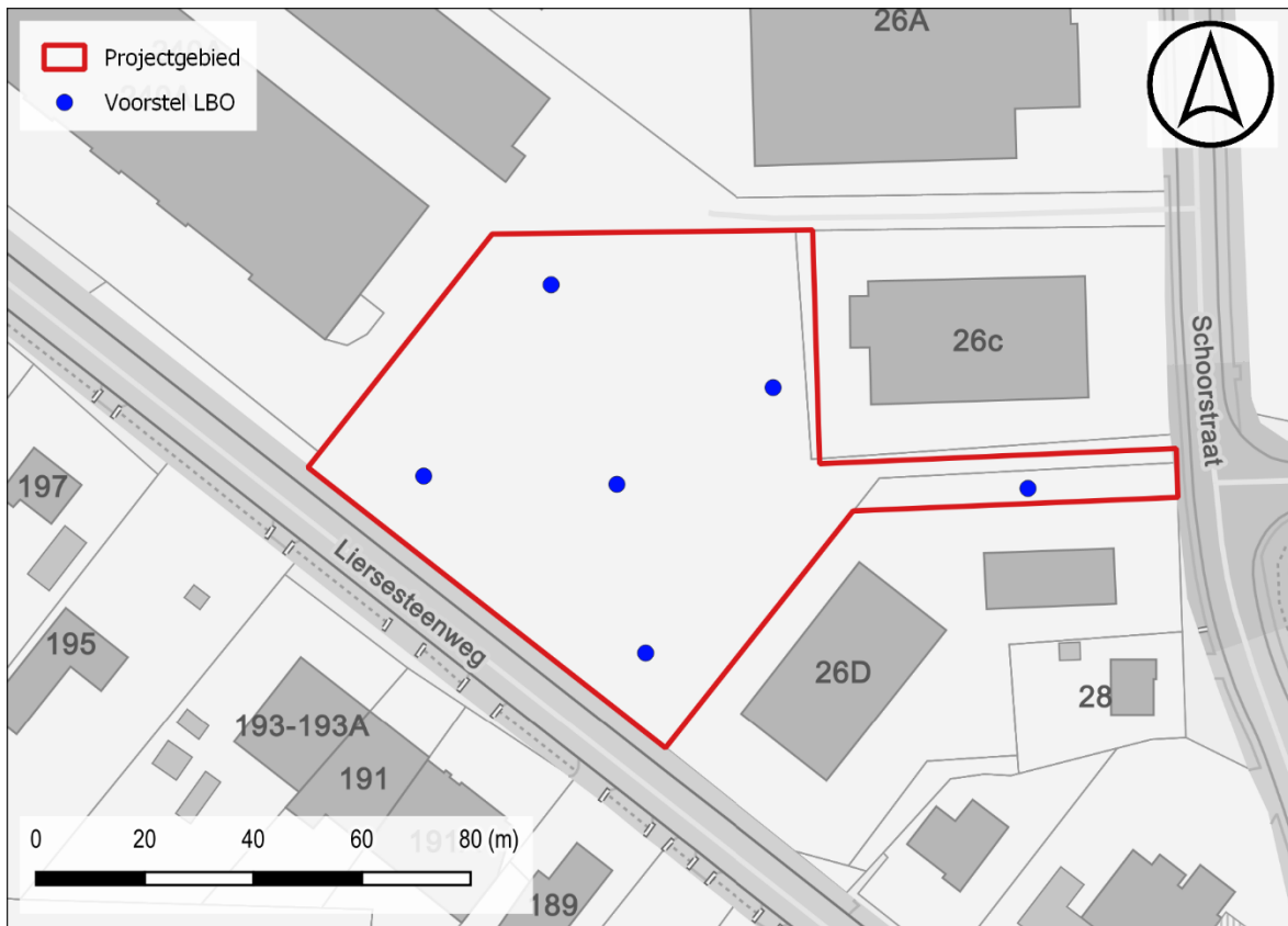
Figuur 2: Voorstel LBO t.a.v. GRB-basiskaart

met profielputten i.p.v. boringen. Dit doet echter geen afbreuk aan de hoeveelheid waarnemingen of de spreiding ervan.