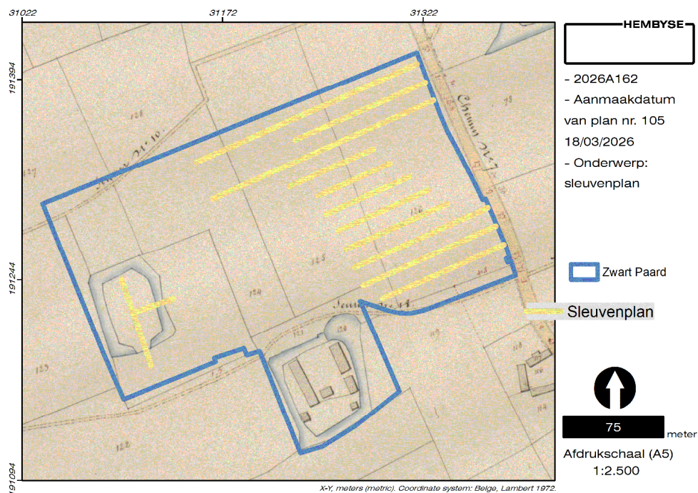
Figuur 1. Geplande situering van de proefsleuven ten opzichte van de Atlas der Buurtwegen.

De proefsleuven dienen te worden aangelegd in twee afzonderlijke zones, met name een oostelijke en noordelijke zone buiten de eigenlijke historische hoeve “Zwart Paard” en een westelijke zone op het hof van een andere, naamloze (en mogelijk oudere) site met walgracht. De ligging en begrenzing van de sleuven is gebaseerd op het hoogteprofiel, de geplande werken en de ligging van historische grachten.