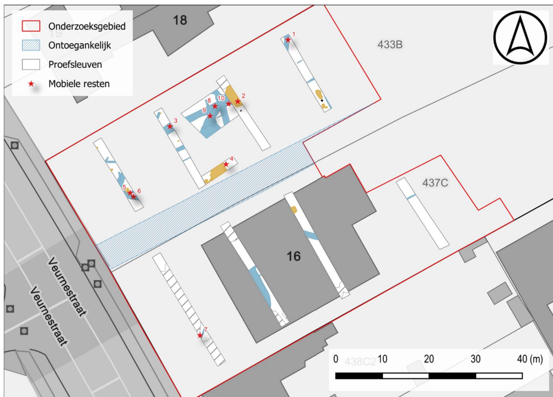
Figuur 4: Spreiding van de mobiele resten t.a.v. grondvaste resten op het GRB.