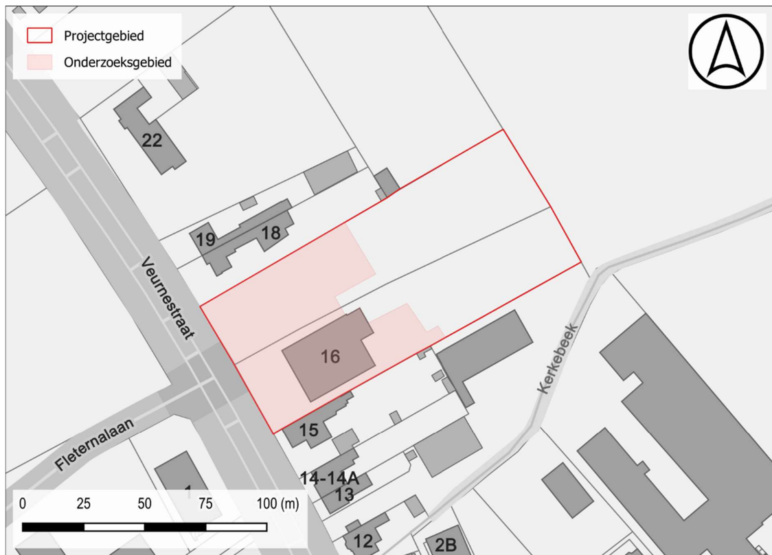
Figuur 2: Projectgebied en onderzoeksgebied proefsleuven weergegeven op de GRB-basiskaart.