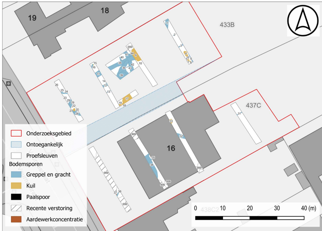
Figuur 3: Overzicht van de verschillende sporetypes op GRB.