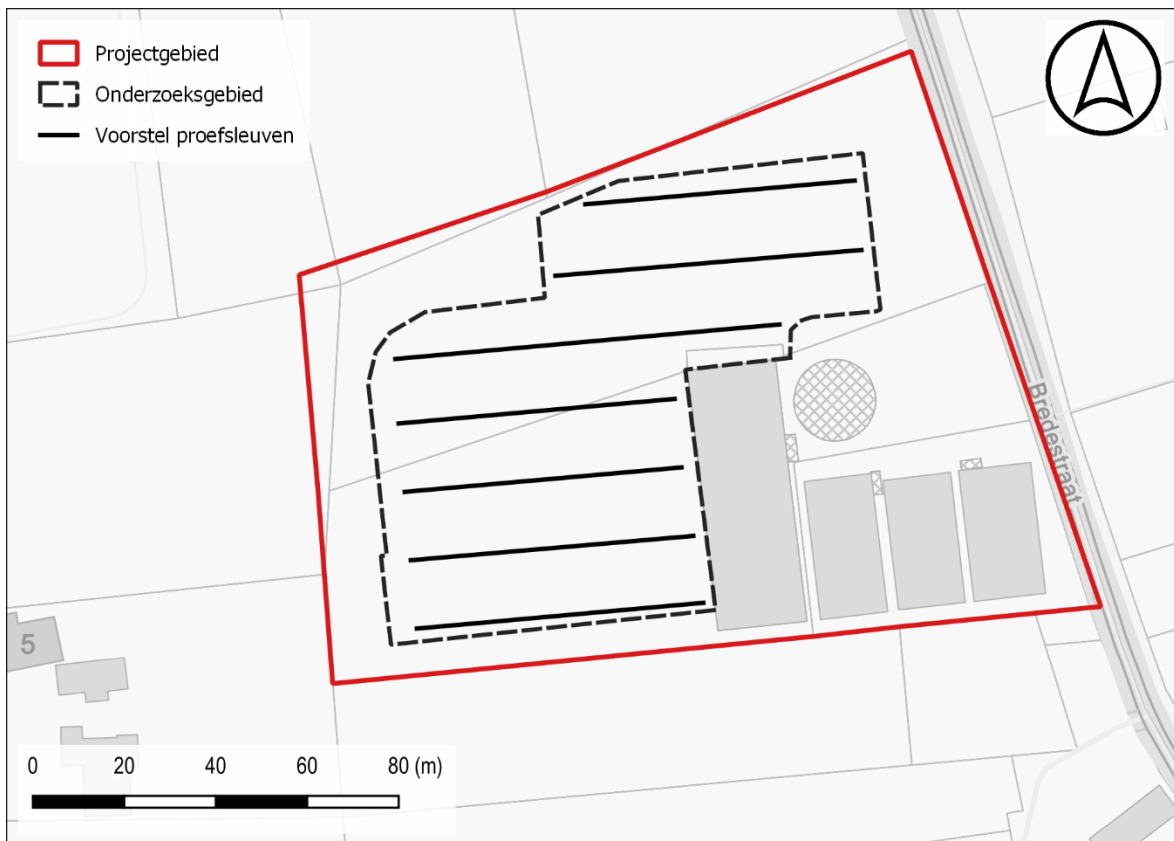
Figuur 4: Voorstel proefsleuven t.a.v. de GRB-basiskaart

De geplande werken hebben betrekking op oppervlakte van ca. 7287 m 2 . De proefsleuven dienen 10% van de onderzoekbare oppervlakte te beslaan met bijkomend ca. 2,5% aan kijkvensters of dwars/volgsleuven waar relevant. De kijkvensters dienen voldoende groot te zijn om een antwoord te kunnen geven op de onderzoeksvragen.