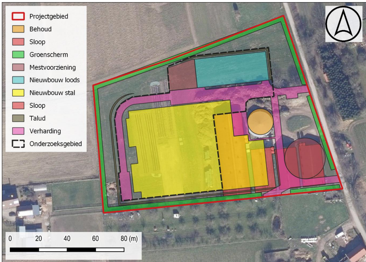
Figuur 2: Onderzoeksgebied weergegeven op de meest recente luchtopname.

De onderzoekssequentie heeft betrekking op de volledige zone waar ingrepen worden uitgevoerd met uitzondering van de zone waar thans mestkelders aanwezig zijn. Het onderzoeksgebied heeft een oppervlakte van ca. 7287 m 2 . Het onderzoek vat aan met een landschappelijk bodemonderzoek. Indien relevante bodemhorizonten bewaard blijken is een archeologische boorcampagne noodzakelijk, eventueel aangevuld met testvakken in functie van artefactensites. Vervolgens is een proefsleuvenonderzoek noodzakelijk in functie van bodemsporen indien dit nog kan leiden tot kenniswinst.