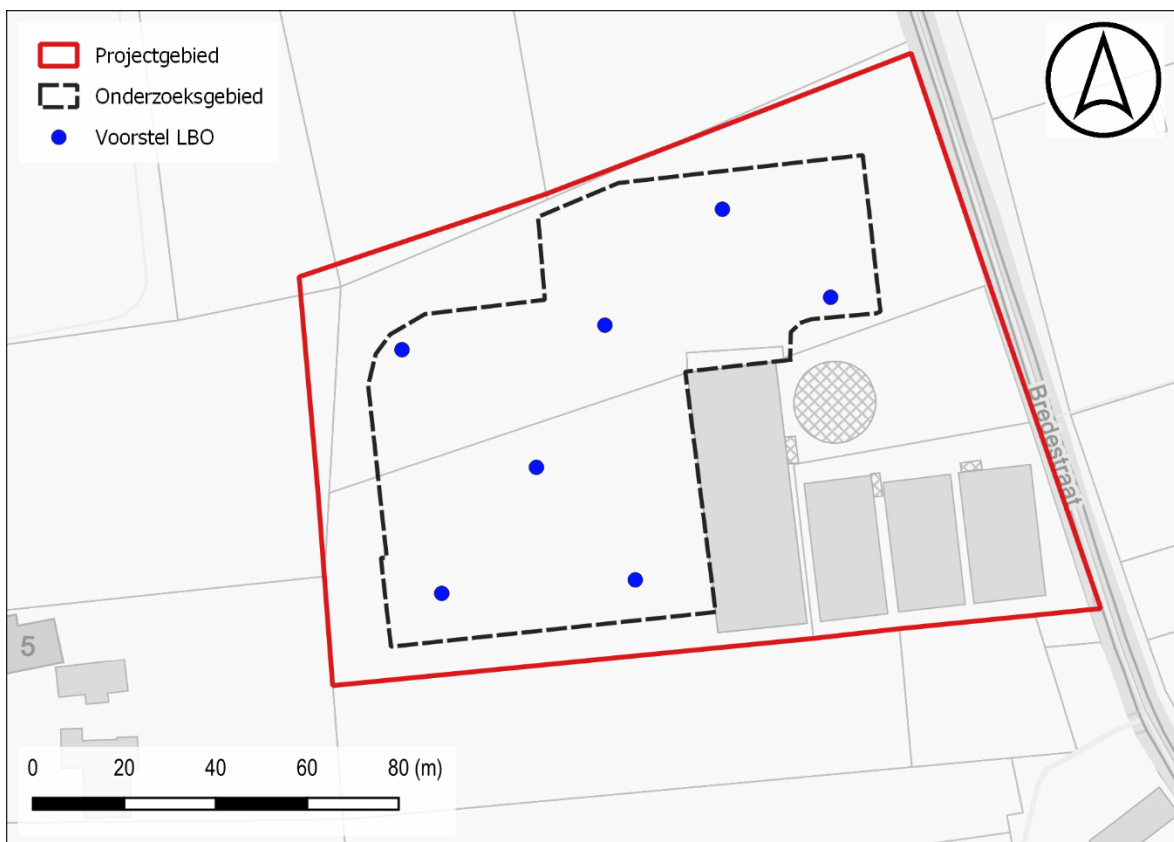
Figuur 3: Voorstel LBO t.a.v. GRB-basiskaart

De landschappelijke boringen worden gezet met een Edelmannboor met diameter van 7 cm. Er wordt minimaal 1 boring per 1000 m 2 gezet. De boringen dienen zo ingeplant te worden dat de waarnemingen toelaten vlakdekkende uitspraken te doen m.b.t. de bodemopbouw en verstoringsgraad. Het staat de uitvoerder van het landschappelijk bodemonderzoek vrij om meer boringen in te planten of de locatie van boringen te wijzigen teneinde een antwoord te kunnen formuleren op de onderzoeksvragen of om verstoorte zones of zones voor verder steentijdonderzoek in detail af te bakenen. Aangezien het landschappelijk bodemonderzoek als doel heeft de bodemopbouw binnen het plangebied te evalueren in functie van de archeologische bewaringscondities, dient het boorresidu niet gezeefd te worden. Mocht het omwille van praktische redenen aangewezen zijn dan kan geopteerd worden om te werken met profielputten i.p.v. boringen. Dit doet echter geen afbreuk aan de hoeveelheid waarnemingen of de spreiding ervan.