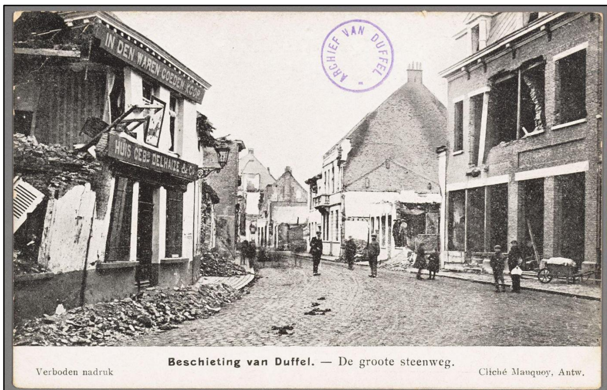
Figuur 3: De Grote Steenweg na de beschietingen van 1914. 4

De regionale beeldbank toont diverse prentbriefkaarten met beschadigde gebouwen in het stadscentrum van Duffel (Figuur 3, Figuur 4, Figuur 5, Figuur 6).