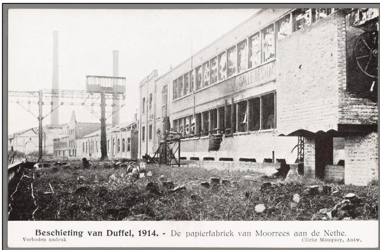
Figuur 6: De papierfabriek na de beschietingen van 1914. 7