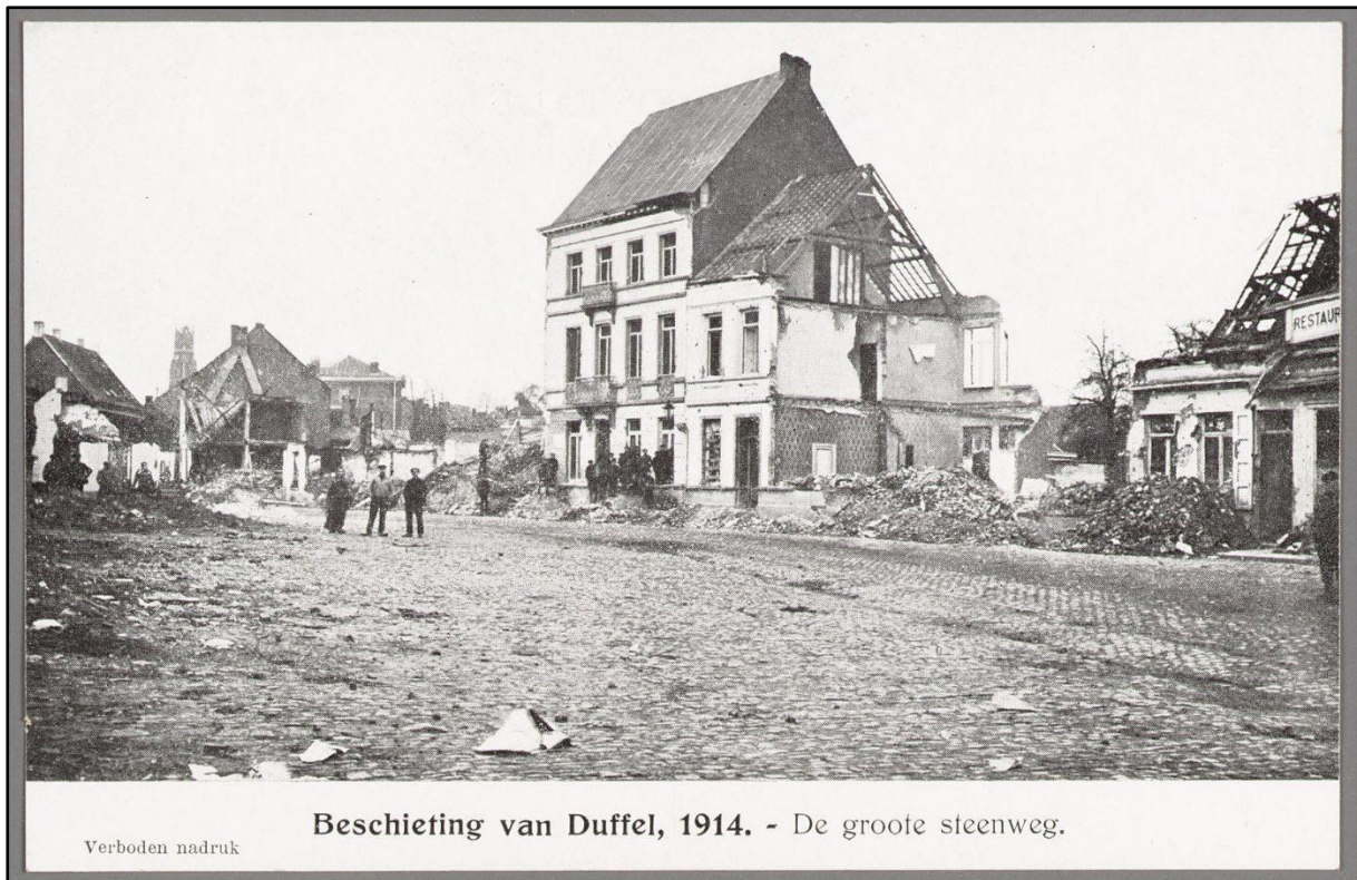
Figuur 4: De Grote Steenweg na de beschietingen van 1914. 5