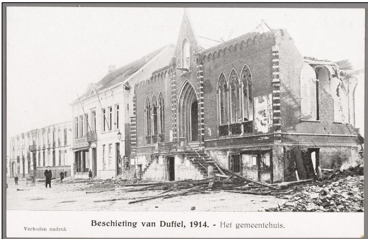
Figuur 5: Het gemeentehuis na de beschietingen van 1914. 6