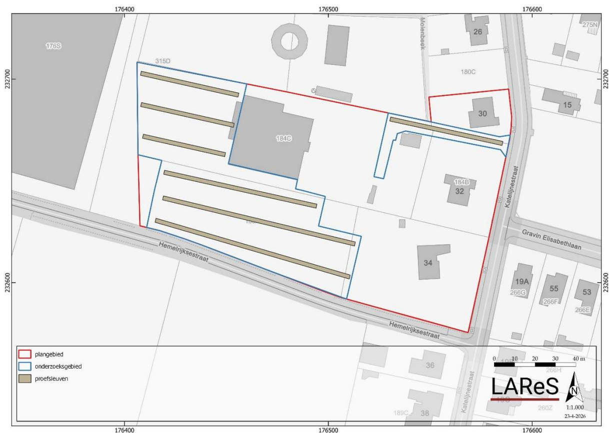
Figuur 3. Indicatieve ligging van de proefsleuven.

Het totale plangebied is 16.497 m 2 groot. Echter, niet het hele plangebied komt in aanmerking voor het proefsleuvenonderzoek aangezien een deel niet ontwikkeld wordt. Het totale te onderzoeken gebied is dan nog 6.783 m 2 groot. 5 Dit betekent dat, rekening houdend met de dekkingsgraad van 12,5 % die door de Code van Goede Praktijk is voorgeschreven, er ongeveer 848 m 2 onderzocht moet worden. Hiervan bedraagt 678 m 2 proefsleuf (10 %) en 170 m 2 volgsleuven of kijkvensters (2,5 %). Aanvullend kunnen nog bijkomende kijkputten of volgsleuven aangelegd worden.