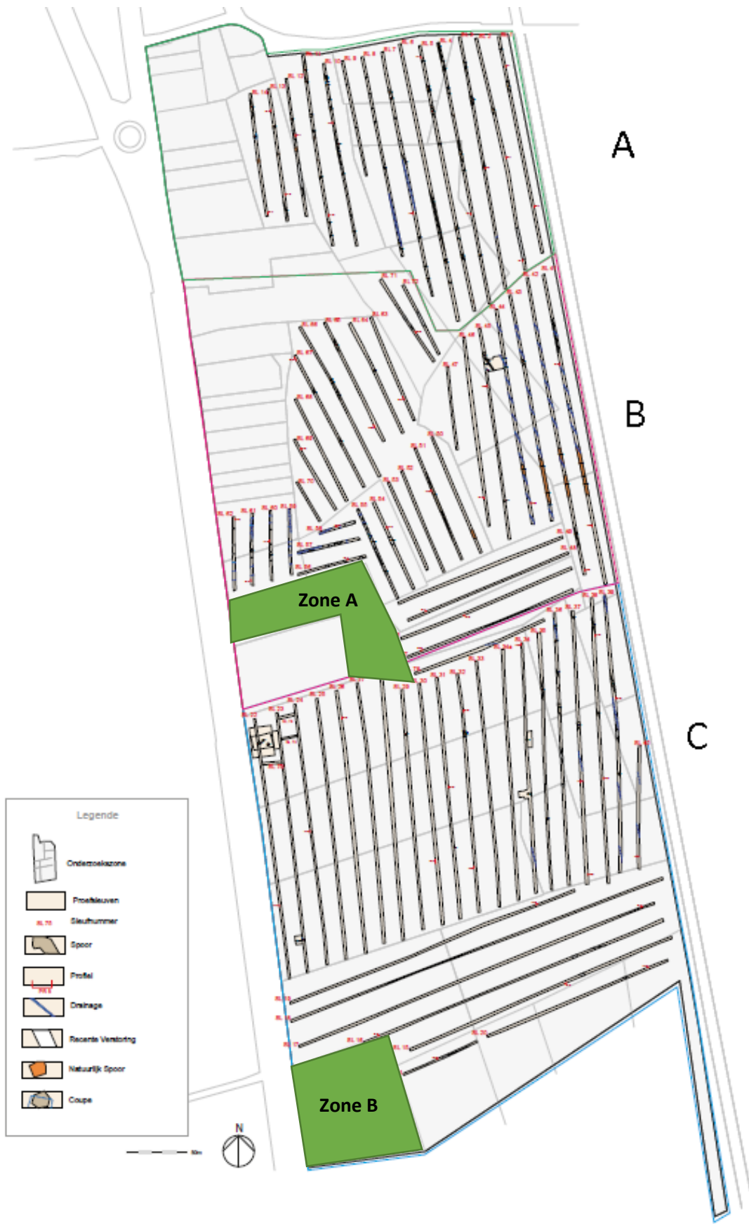
Fig. 2 : Allesporenplan van het proefsleuvenonderzoek uit 2016 met aanduiding van zones A en B.