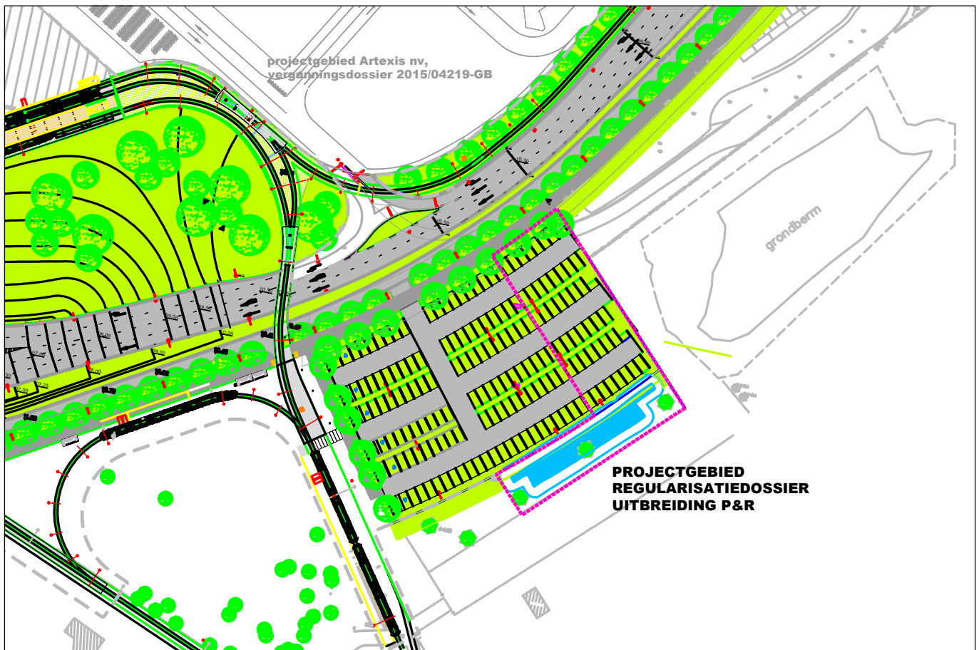
Figuur 52: Een plan van de Park & Ride parking, met projectgebied paars omlijnd

Slechts een klein, driehoekig deel van het projectgebied, dat in het noorden van het projectgebied ligt, maakte geen deel van het archeologisch onderzoek. Deze zone van ongeveer 23 op 7m groot ligt volledig onder de afgebroken loods. Op basis van het aanliggende onderzoek worden hier geen relevante sporen meer verwacht en is er geen verder onderzoek nodig.