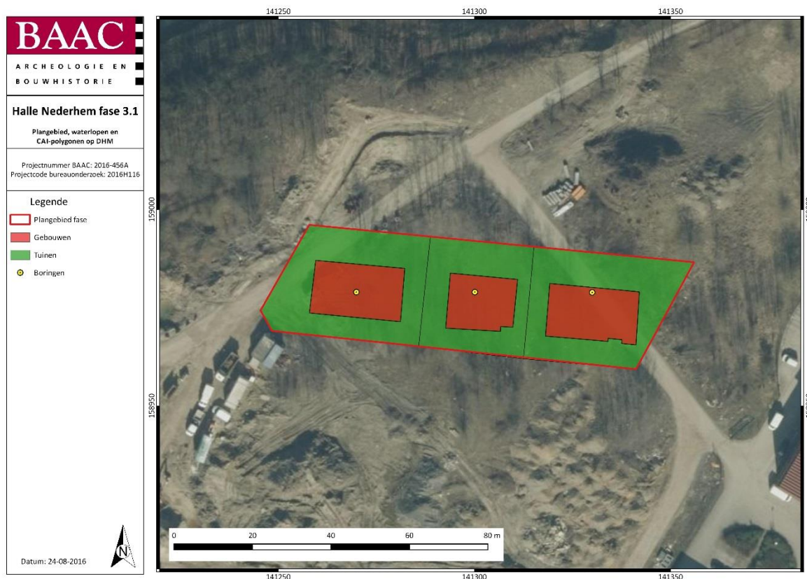
Figuur 1: Plangebied en landschappelijke boringen op GRB.

Het minimum aantal boringen per hectare, noodzakelijk voor een betrouwbaar paleogeografisch inzicht verschilt van auteur tot auteur en varieert grosso modo van 1 tot 25. 2 Het merendeel van de auteurs kiest echter voor een meer pragmatische tussenoplossing van ca. 4 à 5 boringen/hectare (grid van ca. 50 x 50 m). Factoren die daarbij zelden in rekening worden gebracht is de schaal van onderzoek en de geologische complexiteit van het projectgebied. Een dekzandlandschap vraagt een andere aanpak dan een alluviaal gebied. Bovendien dient met betrekking tot het projectgebied ook rekening te worden gehouden met de aard van de ingreep. Met deze factoren rekening houdend stellen we het gebruik van een boorgrid van 30 x 30 m voor (ca. 11 boringen/ha). Voor het plangebied komt dat neer op 10 boringen per ha (zie Figuur 1).