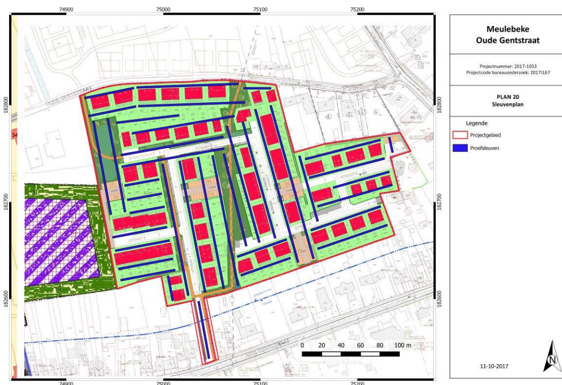
Figuur 3: Voorstel proefsleuvenplan. (A. Devroe 2017)

Op vraag van de opdrachtgever werd voor het sleuvenplan rekening gehouden met de bouwkavels. De sleuven kennen dan ook verschillende oriëntaties. De sleuven hebben een breedte van 2 m en een maximale afstand van 15m van middelpunt tot middelpunt. Aangezien rekening gehouden werd met de bouwkavels is de afstand tussen de sleuven soms iets groter. Er zal minstens 10% van het onderzoeksgebied door middel van proefsleuven onderzocht worden, aangevuld met 2,5% dwarssleuven en/of kijkvensters. De hoeveelheid en locatie van dwarssleuven en/of kijkvensters zijn vrij te bepalen door de erkend archeoloog/veldwerkleider. Een keuze voor of tegen het aanleggen van dwarssleuven en/of kijkvensters wordt gemotiveerd in het verslag van resultaten van het proefsleuvenonderzoek. Kijkvensters en/of dwarssleuven kunnen bijvoorbeeld aangelegd worden om na te gaan of aangetroffen paalkuilen deel uitmaken van een structuur, maar kunnen evenzeer aangelegd worden om een meer exacte afbakening van een archeologische site te bekomen. Voor de aanleg van kijkvenster en/of dwarssleuven wordt geen rekening gehouden met de ligging van de bouwkavels.