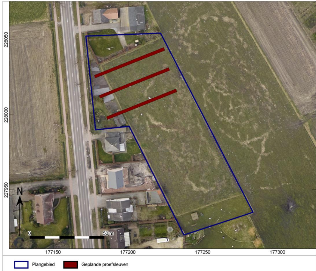
Afb. 2. Aanduiding van het uit te voeren archeologisch onderzoek op een luchtfoto.