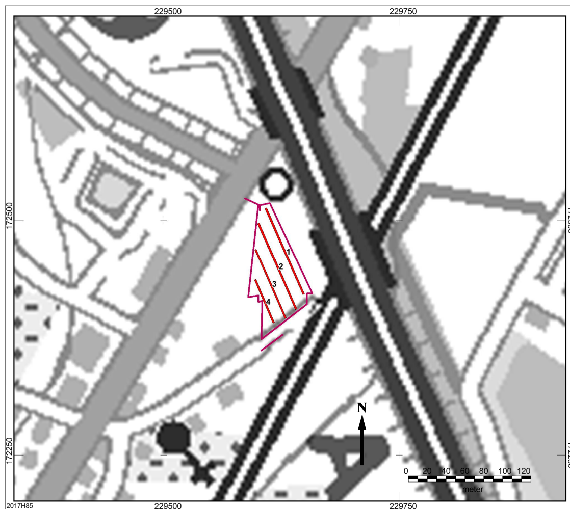
Afbeelding 1: Proefsleuvenplan (rode kader).

Op basis van de resultaten van het bureauonderzoek én het landschappelijk booronderzoek wordt uitgegaan van één archeologisch onderzoeksniveau en dit nabij het oppervlak al zelfs én onder het cultuurdek van een bouwvoor/ploeglaag of eventueel verstoorde lagen onder dit cultuurdek.