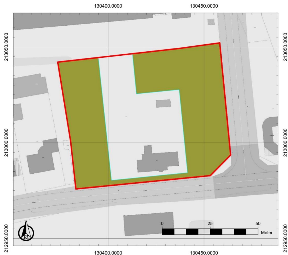
Figuur 2: Zone afgebakend voor verder vooronderzoek (groen) binnen het onderzoeksgebied (rood)

Na elke nieuwe stap in het archeologisch vooronderzoek dient telkens opnieuw de afweging gemaakt te worden of bijkomend archeologisch vooronderzoek nodig is en welke onderzoeksmethodes hiervoor het meest aangewezen zijn. De onderzoeksdoelen zijn succesvol bereikt wanneer de vooropgestelde onderzoeksvragen en de bijkomende onderzoeksvragen die opgesteld worden naar aanleiding van elk assessment beantwoord zijn.