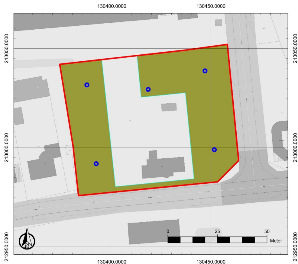
Figuur 3: Inplanting van de landschappelijke boringen (blauw)

Bijkomend booronderzoek in functie van steentijd artefactensites is nodig in de zones waar een goed bewaarde paleobodem met potentieel op een steentijd artefactensites geregistreerd wordt. Ook andere argumenten zoals de ruimtelijke integriteit en de nabijheid van steentijdindicatoren dienen meegenomen te worden in de gemaakte afweging. Voor de criteria verwijzen we naar hoofdstuk 5.2 en 5.3 in de Code van Goede Praktijk. Indien geen goed bewaarde paleobodem met potentieel op een steentijd artefactensite geregistreerd is op het terrein, kan meteen overgegaan worden tot een proefsleuvenonderzoek.