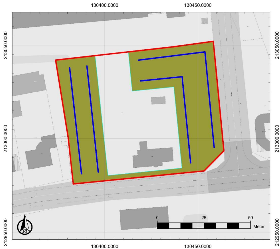
Figuur 4: Inplanting van de proefsleuven (blauw)