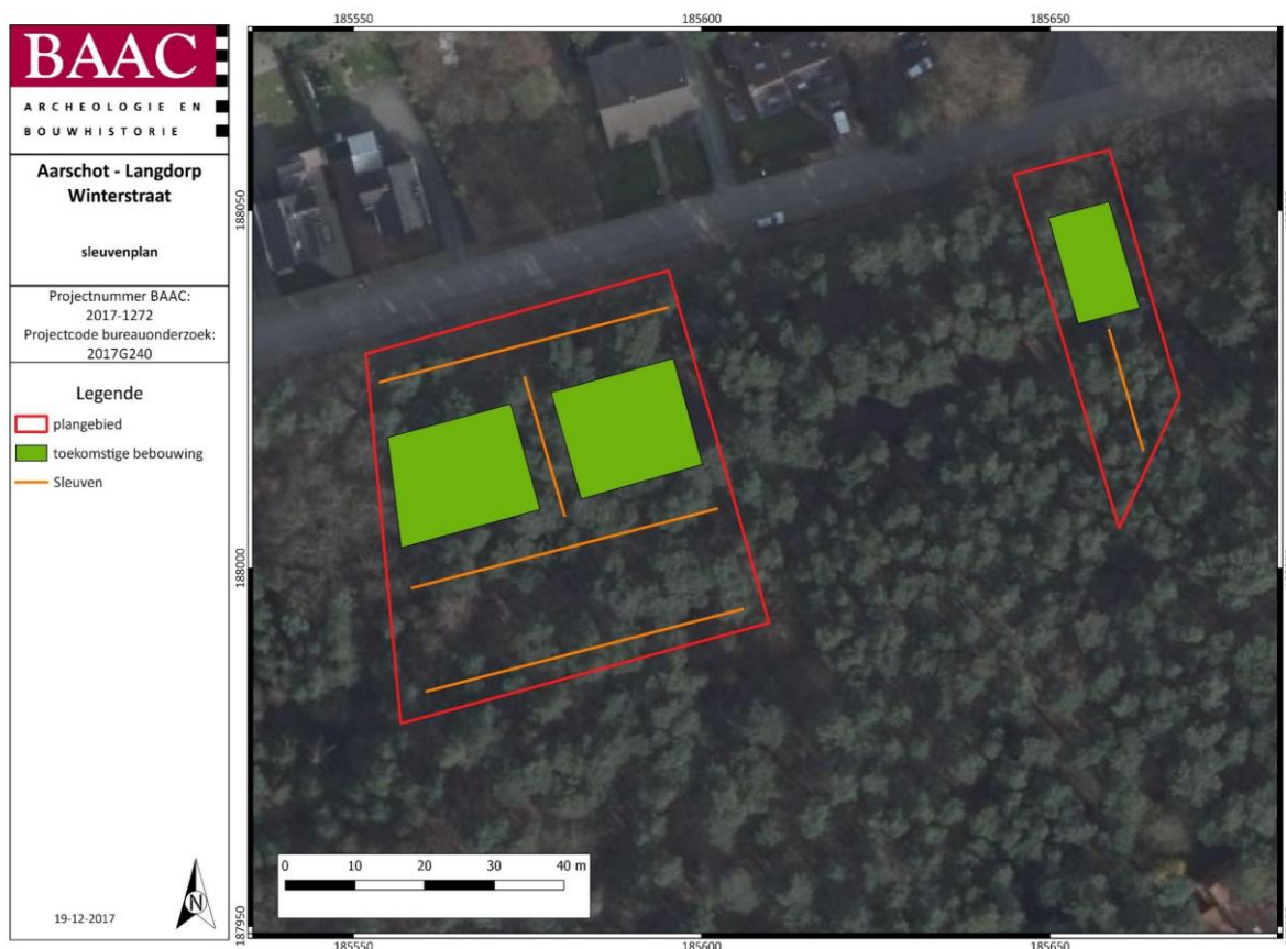
Figuur 2: Inplanting proefsleuven 3

Bij de inplanting van de sleuven werd in eerste instantie rekening gehouden met de geplande bebouwing en topografie van het onderzoeksterrein (Figuur 2). Zo zijn twee sleuven georiënteerd met het verloop van de helling. Drie sleuven worden georiënteerd dwars op de helling van het terrein. Op deze manier maken de sleuven een transect op het landschap.