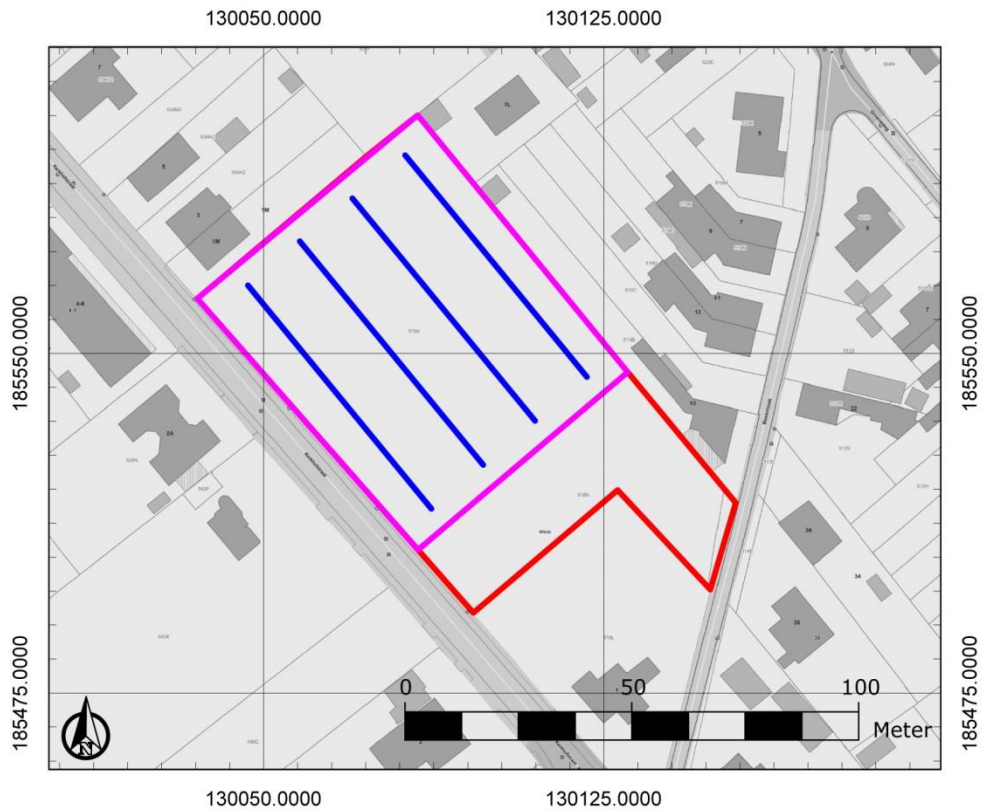
Figuur 4: Inplanting van de proefsleuven (blauw)