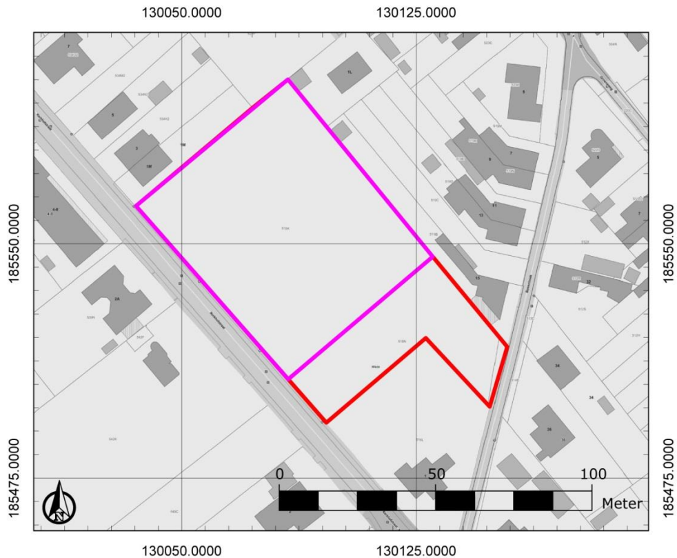
Figuur 2: Zone afgebakend voor verder vooronderzoek (magenta) binnen het onderzoeksgebied (rood)