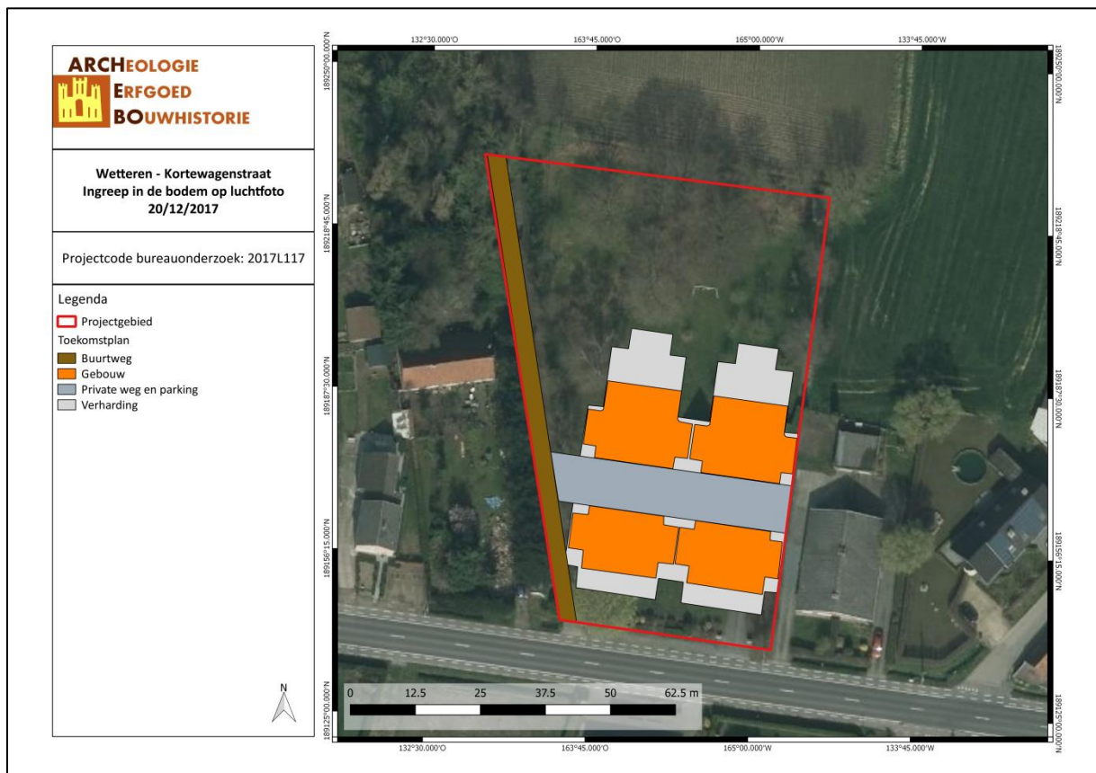
Figuur 3: Geplande bodemingrepen.

een bodemingreep gepland. Binnen deze zone wordt bovendien een verstoring van het bodemarchief verwacht door de aanwezige verharding en onderkelderde woning. Verder archeologisch onderzoek is dan ook niet de meest opportune keuze.