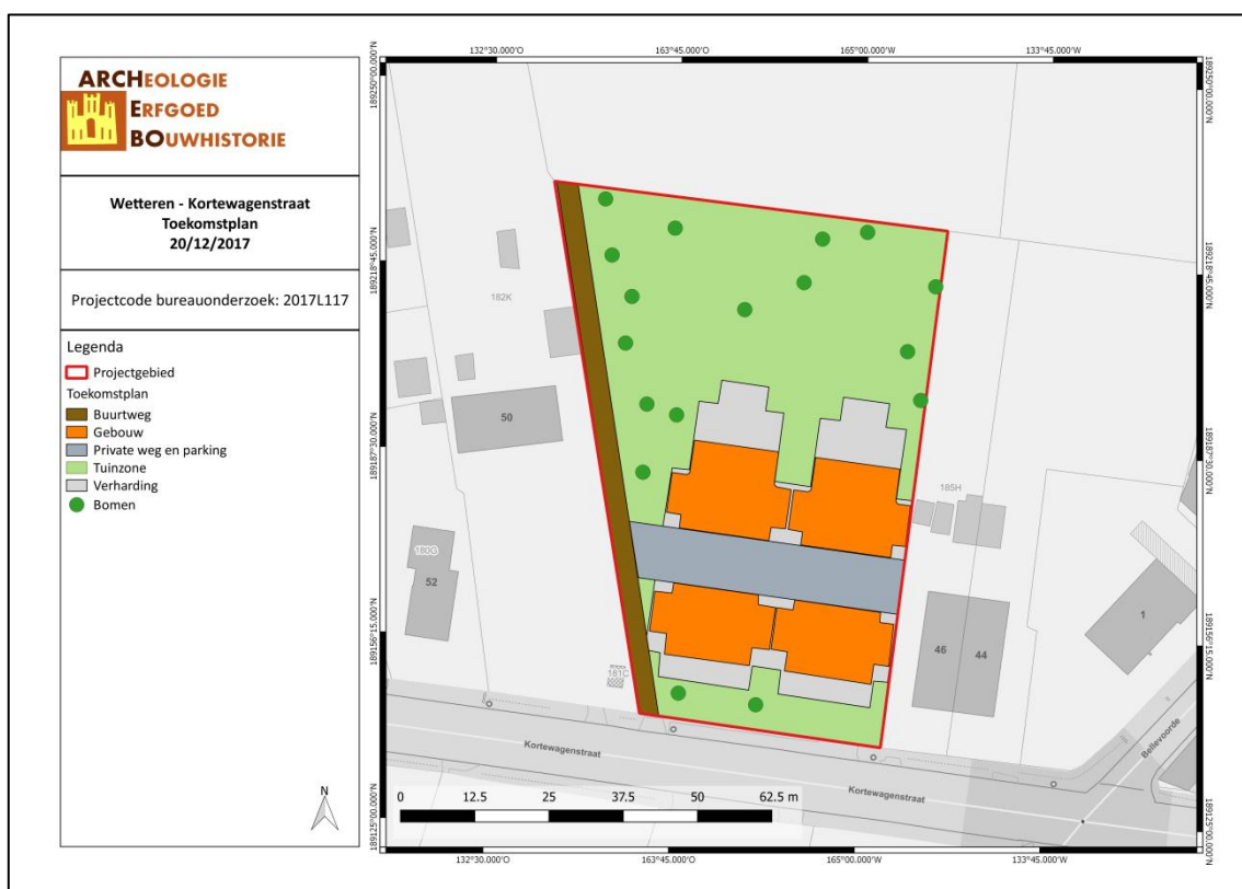
Figuur 2: Toekomstplan

Naar aanleiding van een stedenbouwkundige aanvraag heeft ARCHEBO bvba in opdracht van BUR© Architecten bvba een bureauonderzoek uitgevoerd naar een terrein gelegen aan de Kortewagenstraat te Wetteren. De bestaande bebouwing zal gesloopt worden. Hierna worden op het terrein een woonerf met 8 koppelwoningen voorzien. De bomen in de noordelijke helft van het perceel dienen behouden te blijven. De oppervlakte van het projectgebied bedraagt ca. 4660 m 2 .