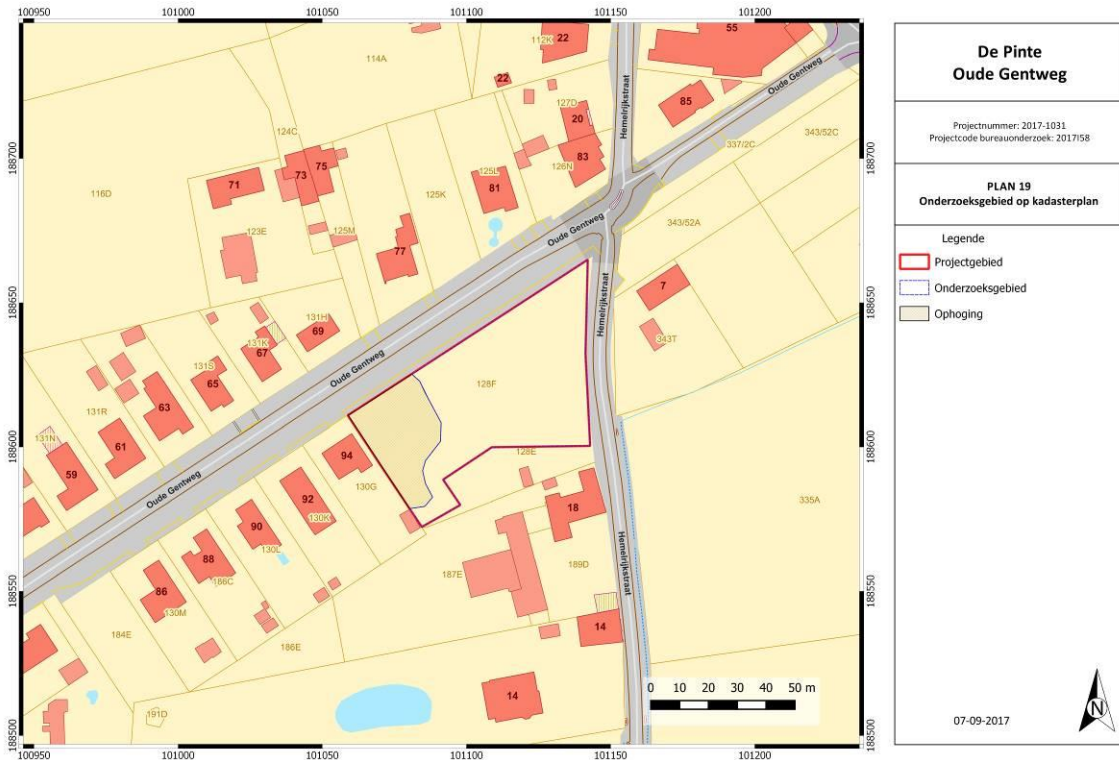
Figuur 2: Kadasterkaart met aanduiding projectgebied. (Geopunt Vlaanderen s.d.)

Oppervlakte onderzoeksgebied: ca. 3000 m 2