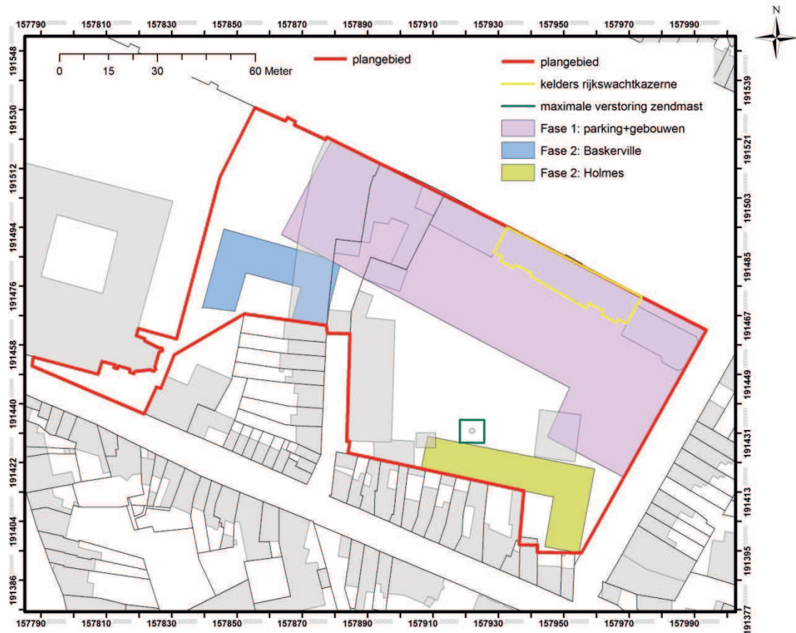
Fig.2: Kadasterkaart met aanduiding van het plangebied, de gekende verstoringslijnen en de inplanting van de nieuwe gebouwen. In het blauw gebouw 'Baskerville'.

Het gebouw wordt niet onderkelderd. De inplanting van het gebouw, met een oppervlakte van ca. 675m 2 , is reeds concreet. De exacte bouwwijze van het gebouw is echter nog niet gekend. Naar de huidige verwachting zal het gebouw gefundeerd worden op palen, dus met een diepe funderingsaanzet (mededeling per mail door D. Vanermen, stabiliteitsingenieur Willemen Real Estate NV).