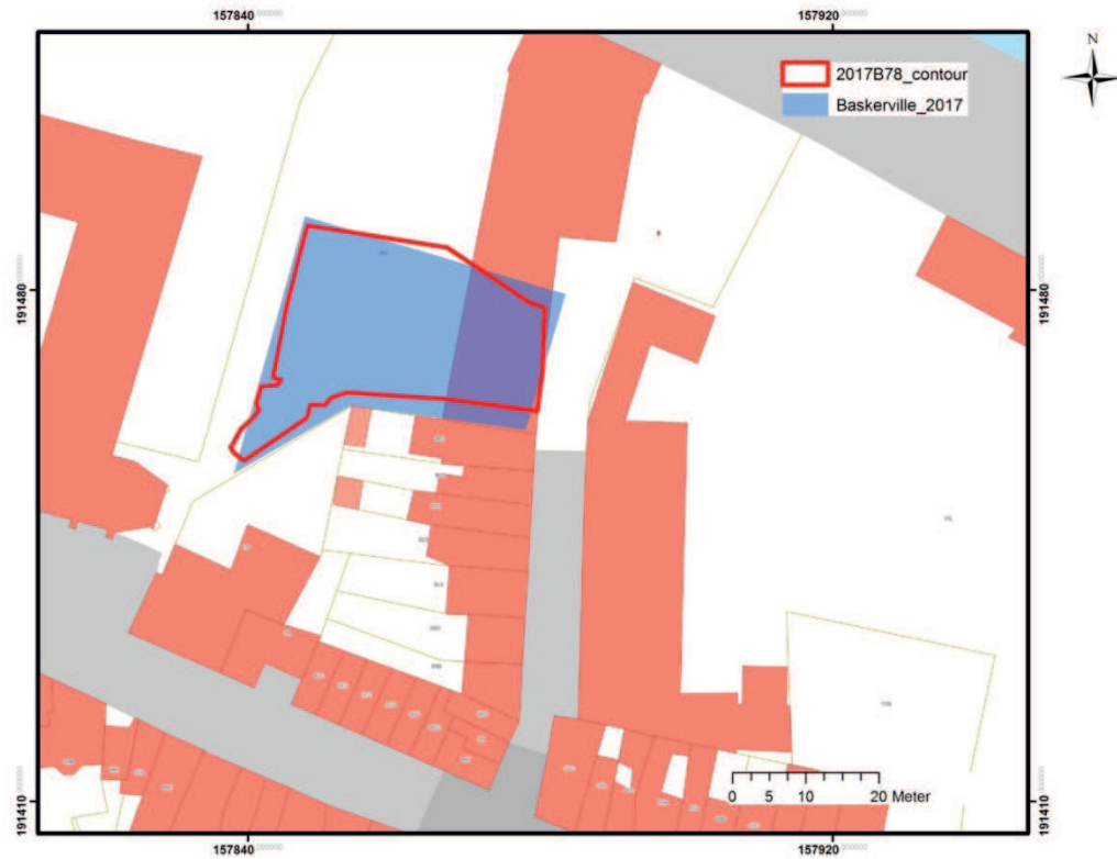
Fig. 1: Kadasterkaart met weergave van de zone waar geen (belangrijke) steentijd artefactensite aanwezig is (rood).