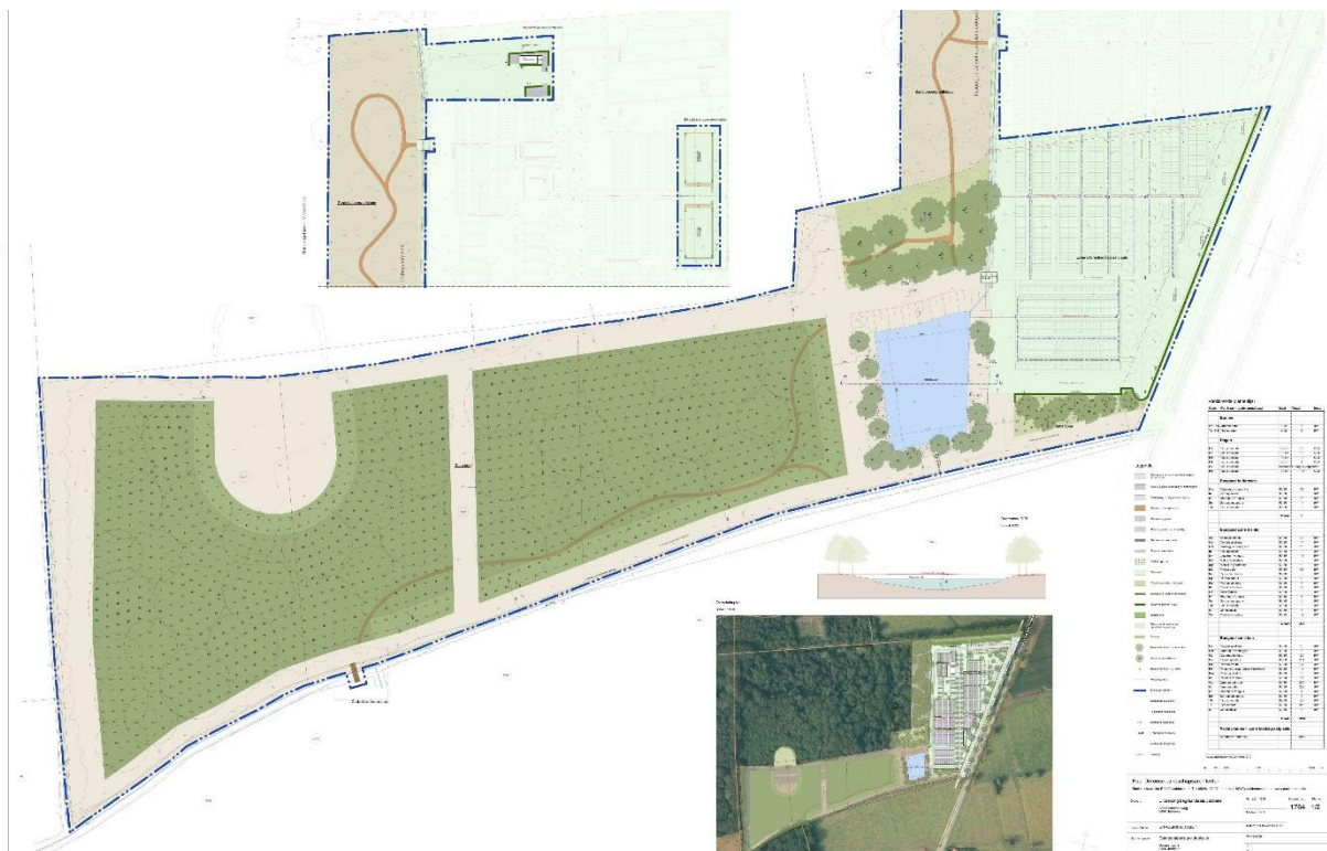
Figuur 1: Overzicht van de geplande werken

De Gemeente Jabbeke plant de uitbreiding van de begraafplaats van Jabbeke langs de Aartrijksesteenweg. Op enkele percelen langs de Aartrijksesteenweg in Jabbeke wordt de uitbreiding van de begraafplaats en de aanplanting van een bos voorzien. Om de mogelijke aantasting van het bodemarchief op deze terreinen in te schatten werkt Gemeente Jabbeke samen met AardeWerk, Raakvlak Archeologisch Onderzoek. Doel van de opdracht is het waarderen van het terrein aan de hand van een bureauonderzoek, een landschappelijk bodemonderzoek en een proefsleuvenonderzoek. De combinatie van de verschillende onderzoeksmethode resulteert in een Verslag van Resultaten.