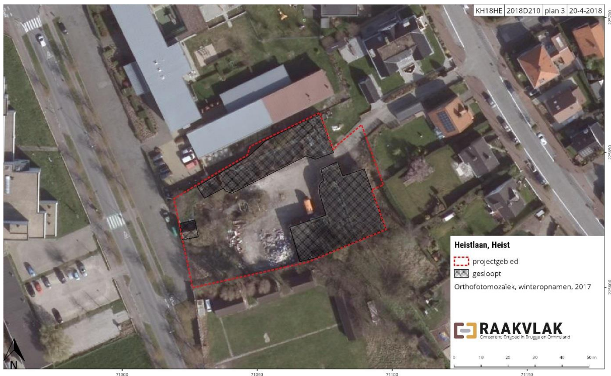
Figuur 1: Het ontwerpplan op de orthofoto 2017 (agiv)

De Gemeente Knokke-Heist plant de aanleg van een parking op een plaats waar enkele gebouwen gesloopt zijn. De oppervlakte van de geplande werken bedraagt 3.148,330 m 2 . Om de mogelijke aantasting van het bodemarchief op deze terreinen in te schatten werkt Gemeente Knokke-Heist samen met Aardewerk, Raakvlak Archeologisch Onderzoek. Doel van de opdracht is het waarderen van het terrein aan de hand van een bureauonderzoek. Dit onderzoek resulteert in een archeologienota.