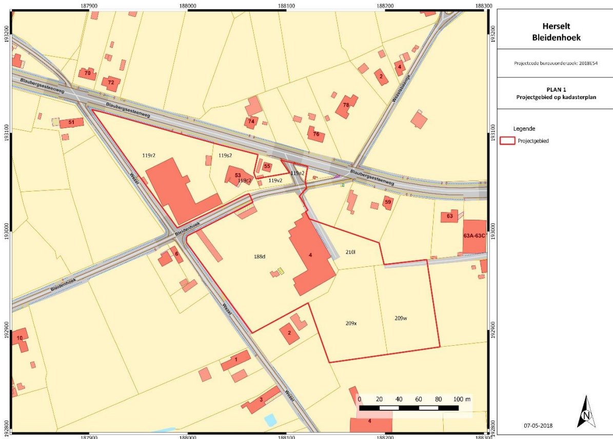
Figuur 2: Kadasterkaart met aanduiding projectgebied. (Geopunt Vlaanderen s.d.)

Oppervlakte projectgebied/onderzoeksgebied: ca. 35.686 m 2