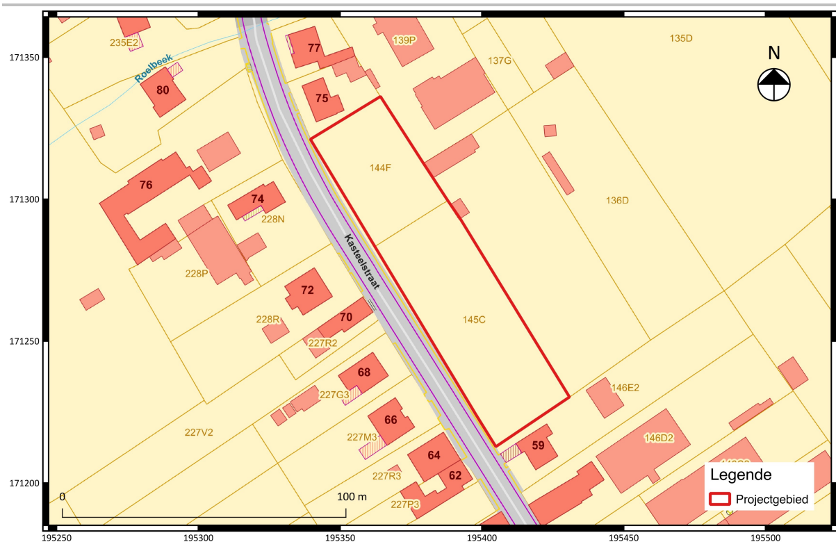
Fig. 3.1: Uittreksel van de kadastrale kaart met situering van het projectgebied (©CADGIS).