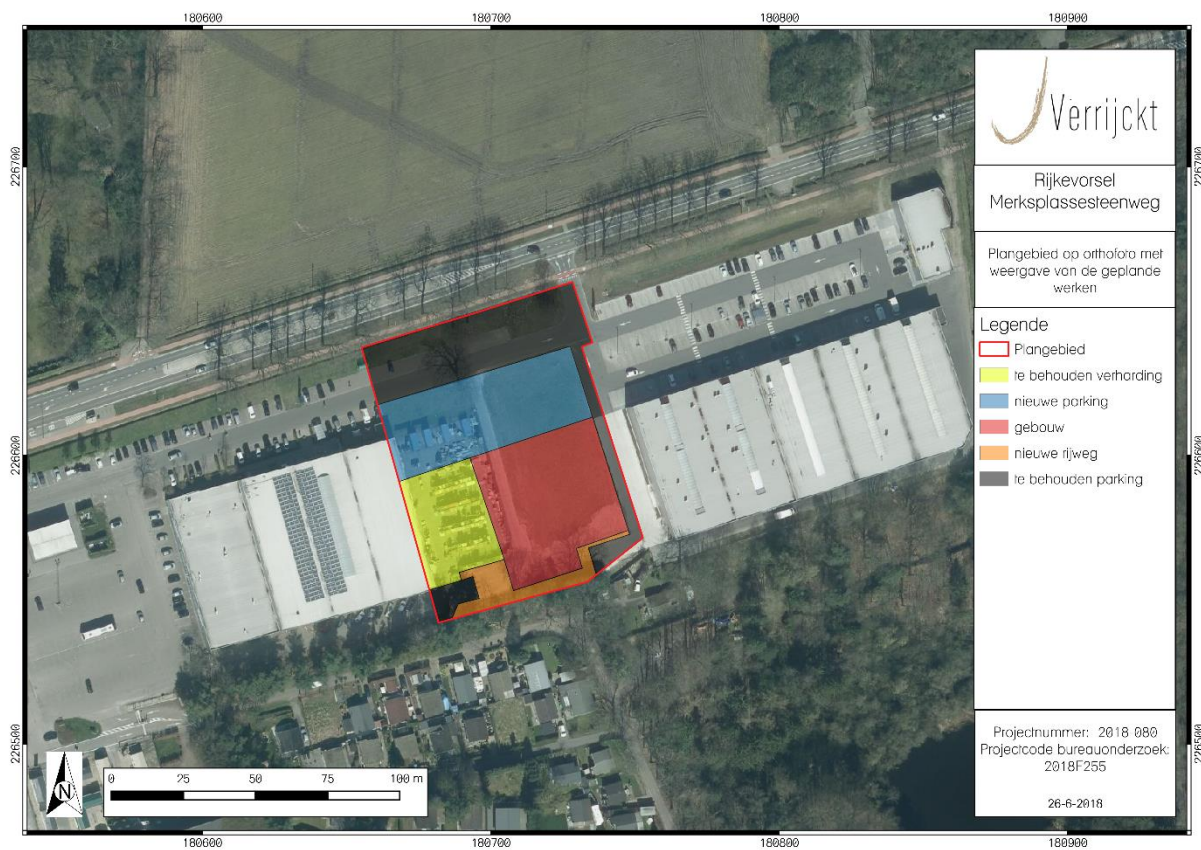
Figuur 1: Plangebied met weergave van toekomstige inplanting 1 op orthofoto.