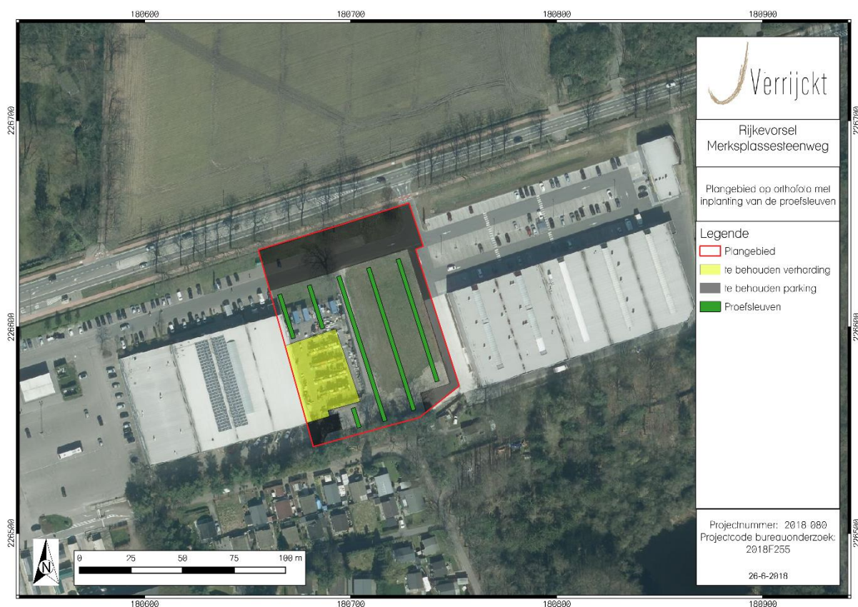
Figuur 4: Mogelijke inplanting van de proefsleuven.

In Figuur 4 is de mogelijke inplanting van de proefsleuven weergegeven. Indien er geen goed bewaarde sites uit de steentijd aanwezig zijn en eventuele archeologische niveaus door de geplande werken verstoord worden, dienen er zes proefsleuven met een noord-zuid oriëntatie worden aangelegd. In totaal wordt er op deze manier 500 m 2 onderzocht (11% van de totale oppervlakte). De proefsleuven worden aangevuld met de nodige kijkvensters. Indien een gedeelte van het plangebied een goed bewaarde site uit de steentijd herbergt, dient het sleuvenplan dusdanig aangepast te worden, zodat deze sites gevrijwaard worden van het proefsleuvenonderzoek. Indien de geplande werken over een gedeelte van het plangebied geen versturende impact hebben op het archeologische niveau, dient het sleuvenplan eveneens aangepast te worden.