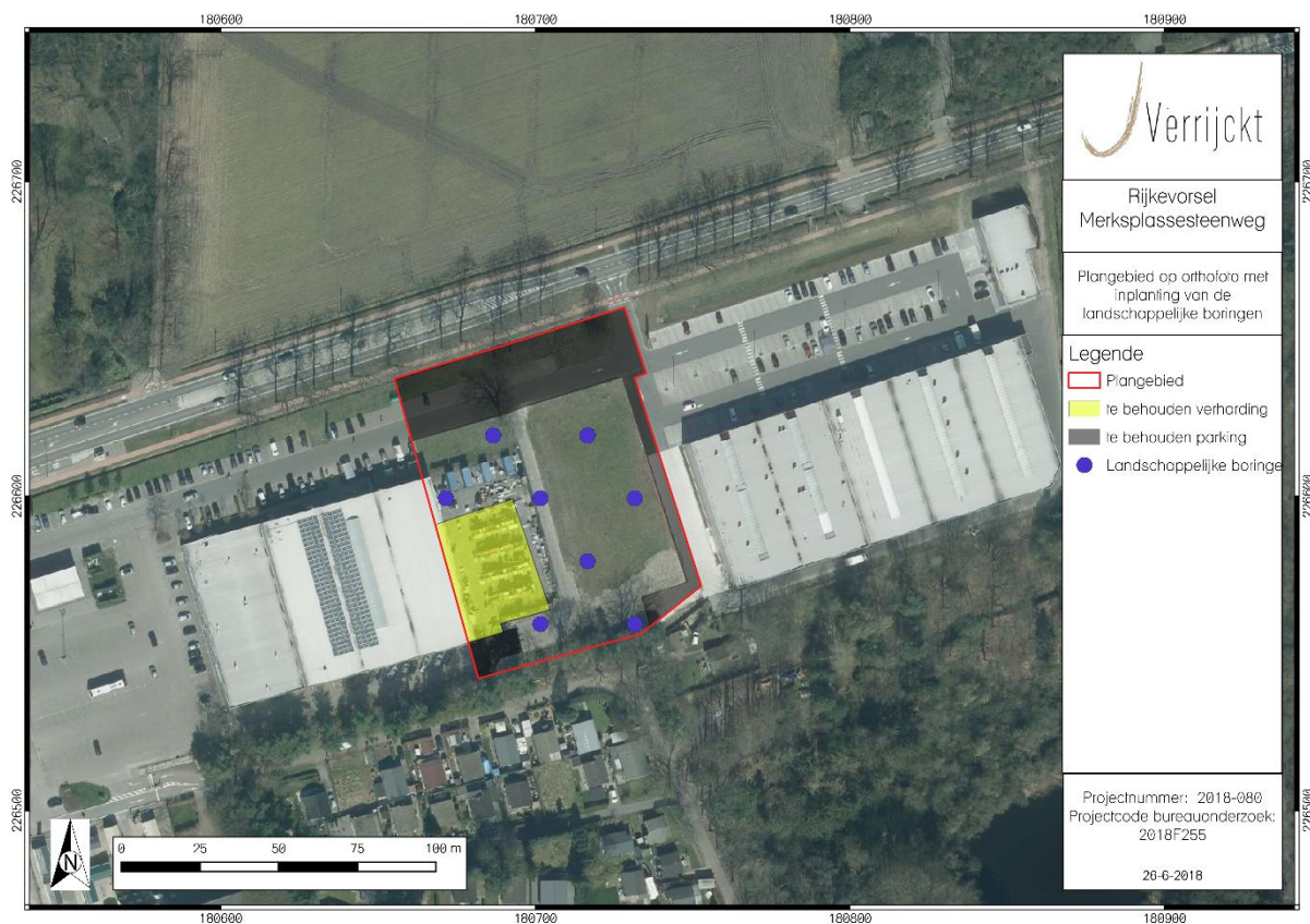
Figuur 3: Inplanting landschappelijke boringen