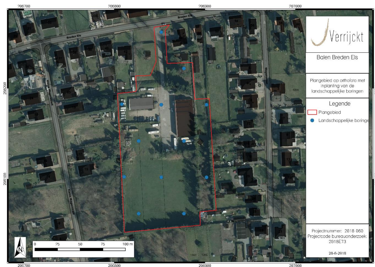
Figuur 2: Inplanting landschappelijke boringen

Binnen het plangebied worden de boringen geplaatst in een verspringend driehoeksgrid van 50 x 40 m. Concreet betekend dit dat er binnen het plangebied 12 boringen geplaatst worden. Mocht ter plaatse blijken dat deze vooropgestelde boorpunten onuitvoerbaar of ontoegankelijk zijn kan de veldwerkleider ter plaatse evalueren en herlokalisieren. Het verplaatste boorpunt wordt in dat geval opnieuw ingemeten en aangeduid op de kaart.