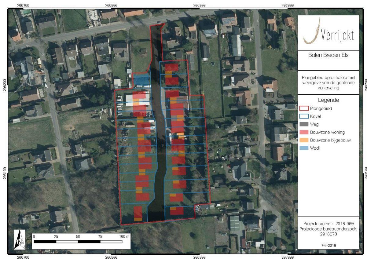
Figuur 1: Geplande werken