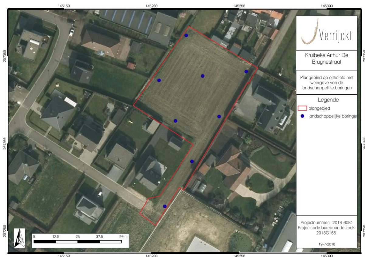
Figuur 2: Inplanting landschappelijke boringen

Binnen het plangebied worden de boringen geplaatst in een verspringend driehoeksgrid van 30 x 20 m. Concreet betekend dit dat er binnen het plangebied 8 boringen geplaatst worden. Mocht ter plaatse blijken dat deze vooropgestelde boorpunten onuitvoerbaar of ontoegankelijk zijn kan de veldwerkleider ter plaatse evalueren en herlokaliseren. Het verplaatste boorpunt wordt in dat geval opnieuw ingemeten en aangeduid op de kaart.