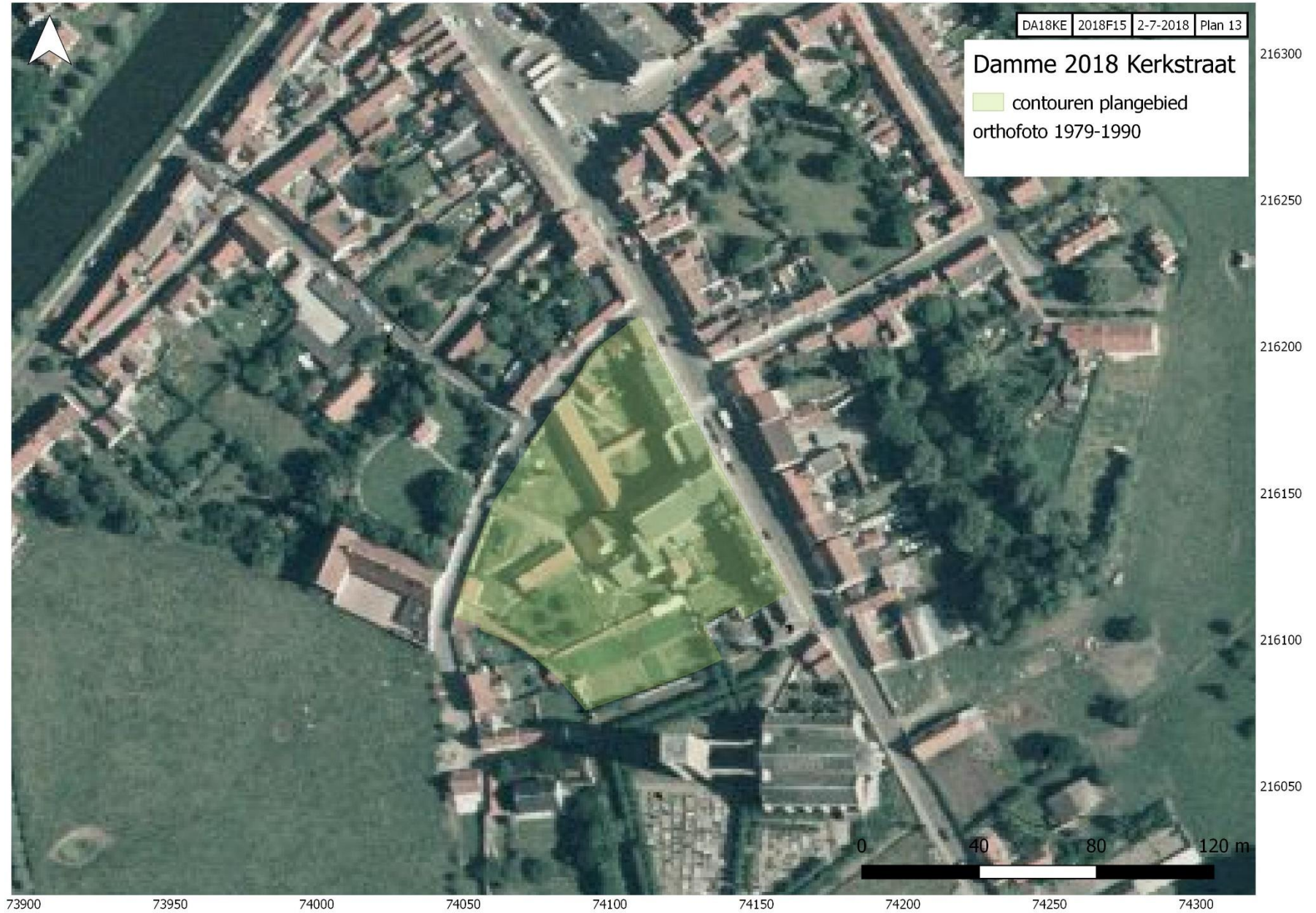
Plan 13: Het projectgebied weergegeven op de orthofoto, situatie 1979-1990 (groene polygoon)