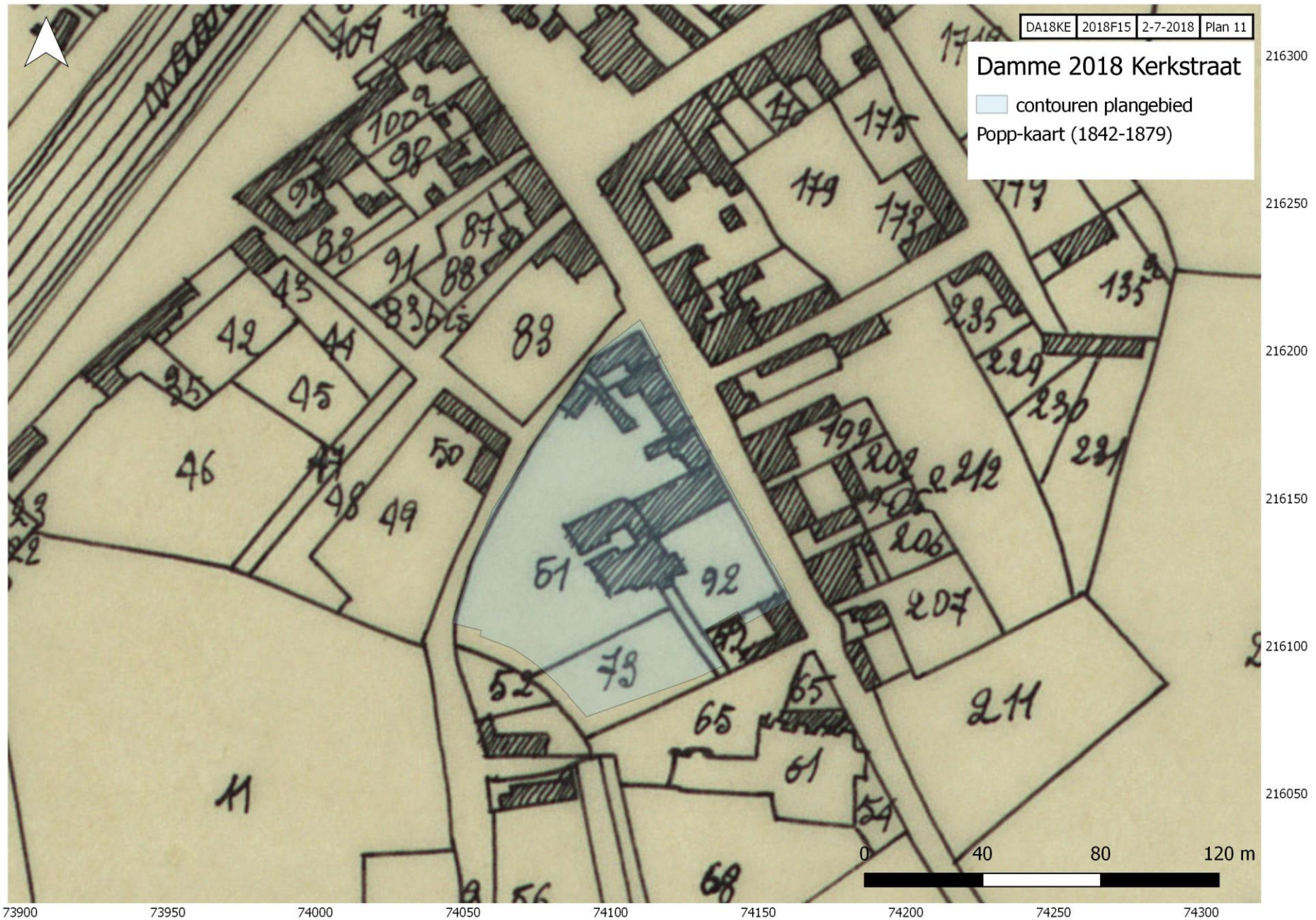
Plan 11: Het projectgebied weergegeven op de Popp-kaart (1842-1879) (blauwe polygoon)