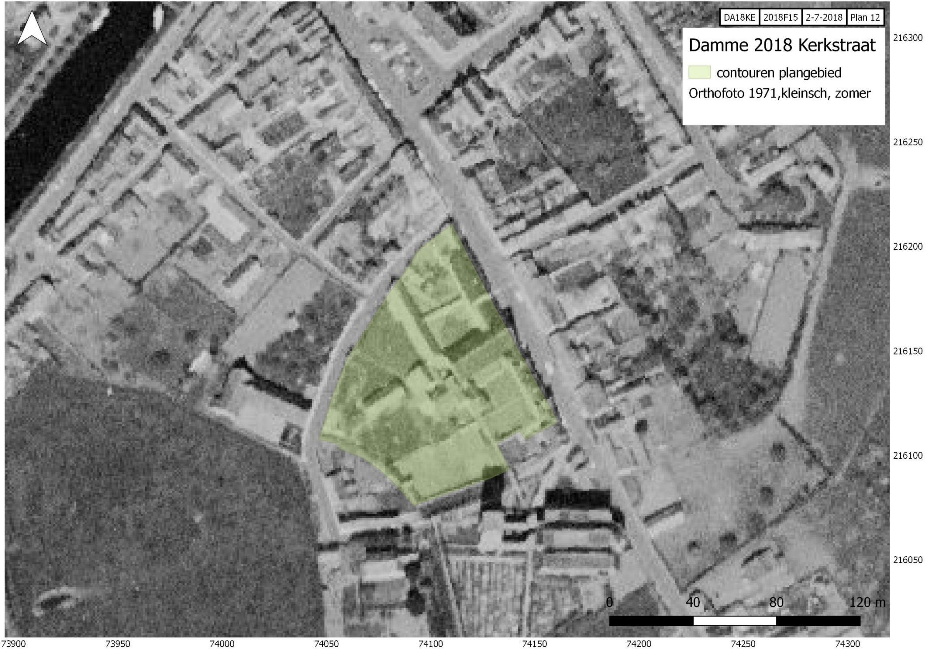
Plan 12: Het projectgebied weergegeven op de orthofoto, situatie 1971 (groene polygoon)