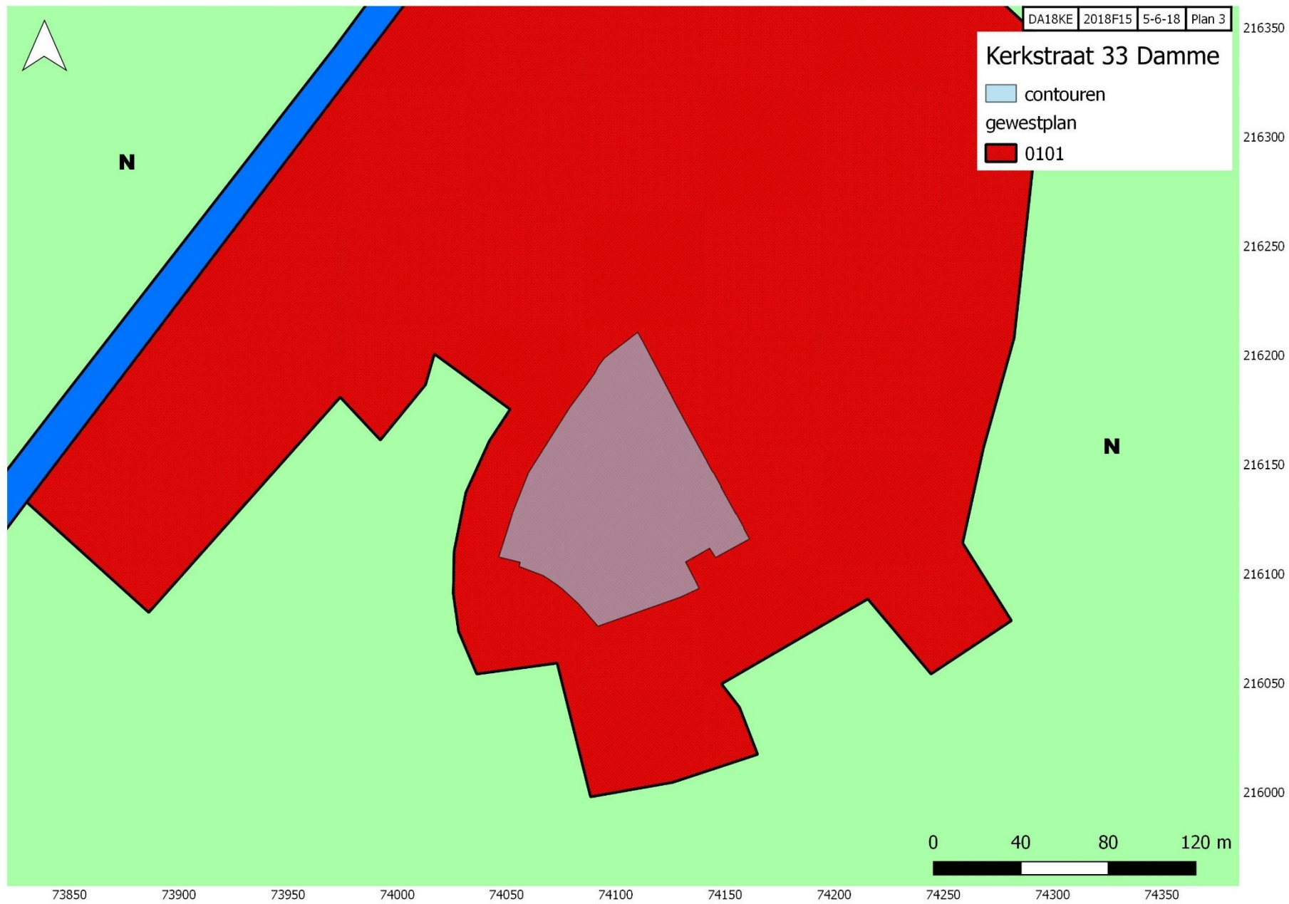
Plan 3: het projectgebied weergegeven op het gewestplan (roze polygoon)