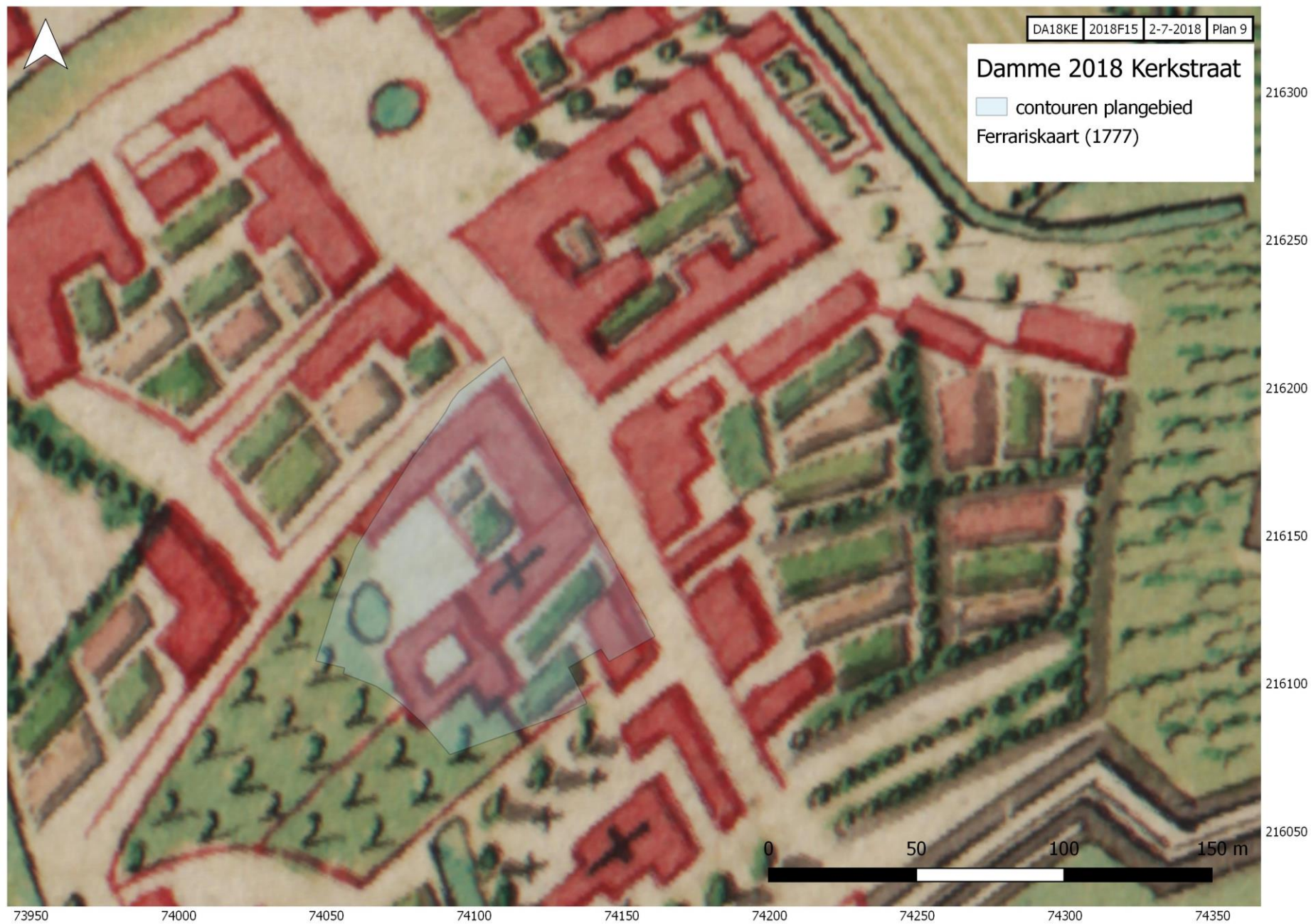
Plan 9: het projectgebied weergegeven op de Kabinetskaart (blauwe polygoon)