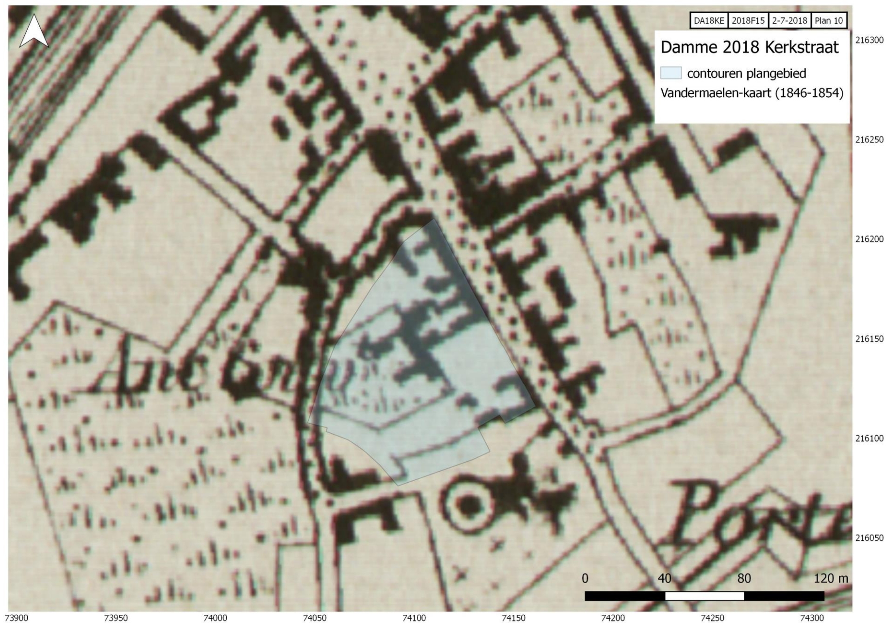
Plan 10: Het projectgebied weergegeven op de kaart van Vandermaelen (blauwe polygoon)