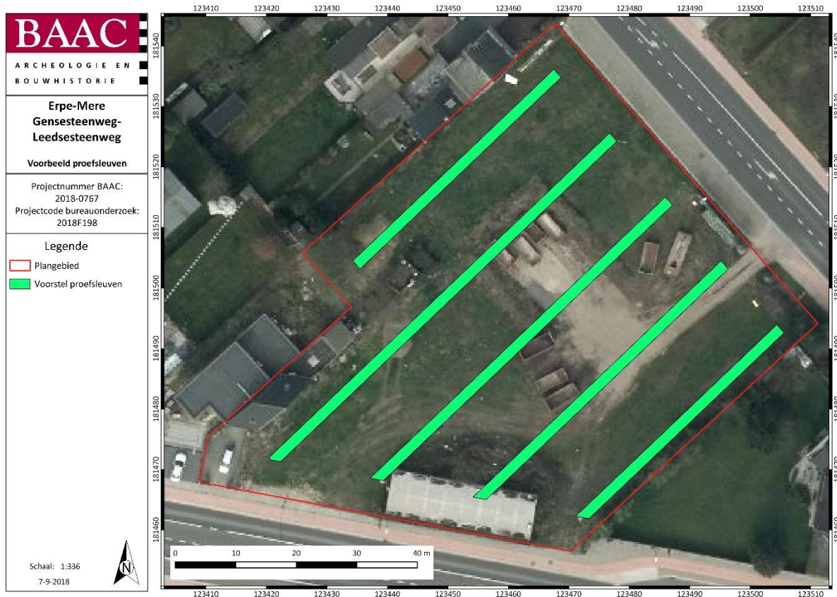
Plan 2: Inplanting proefsleuven