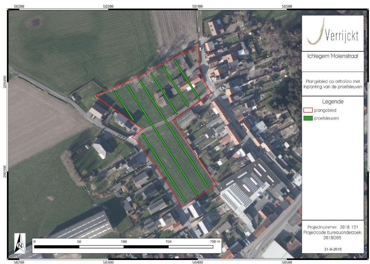
Figuur 3: Sleuvenplan

In Figuur 3 is de mogelijke inplanting van de proefsleuven weergegeven. Indien er geen goed bewaarde sites uit de steentijd aanwezig zijn, dienen er zeven proefsleuven te worden aangelegd. In totaal wordt er op deze manier 1100 m 2 onderzocht (10,75 % van de totale oppervlakte). De proefsleuven worden aangevuld met de nodige kijkvensters. Indien een gedeelte van het plangebied een goed bewaarde site uit de steentijd herbergt, dient het sleuvenplan dusdanig aangepast te worden, zodat deze sites gevrijwaard worden van het proefsleuvenonderzoek.