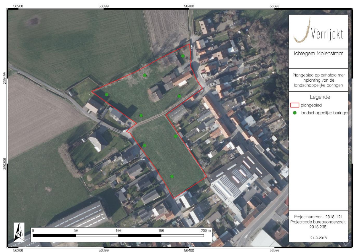
Figuur 2: Inplanting landschappelijke boringen

Binnen het plangebied worden de boringen geplaatst in een verspringend driehoeksgrid van 30 x 20 m. Concreet betekend dit dat er binnen het plangebied 8 boringen geplaatst worden. Mocht ter plaatse blijken dat deze vooropgestelde boorpunten onuitvoerbaar of ontoegankelijk zijn kan de veldwerkleider ter plaatse evalueren en herlokaliseren. Het verplaatste boorpunt wordt in dat geval opnieuw ingemeten en aangeduid op de kaart.