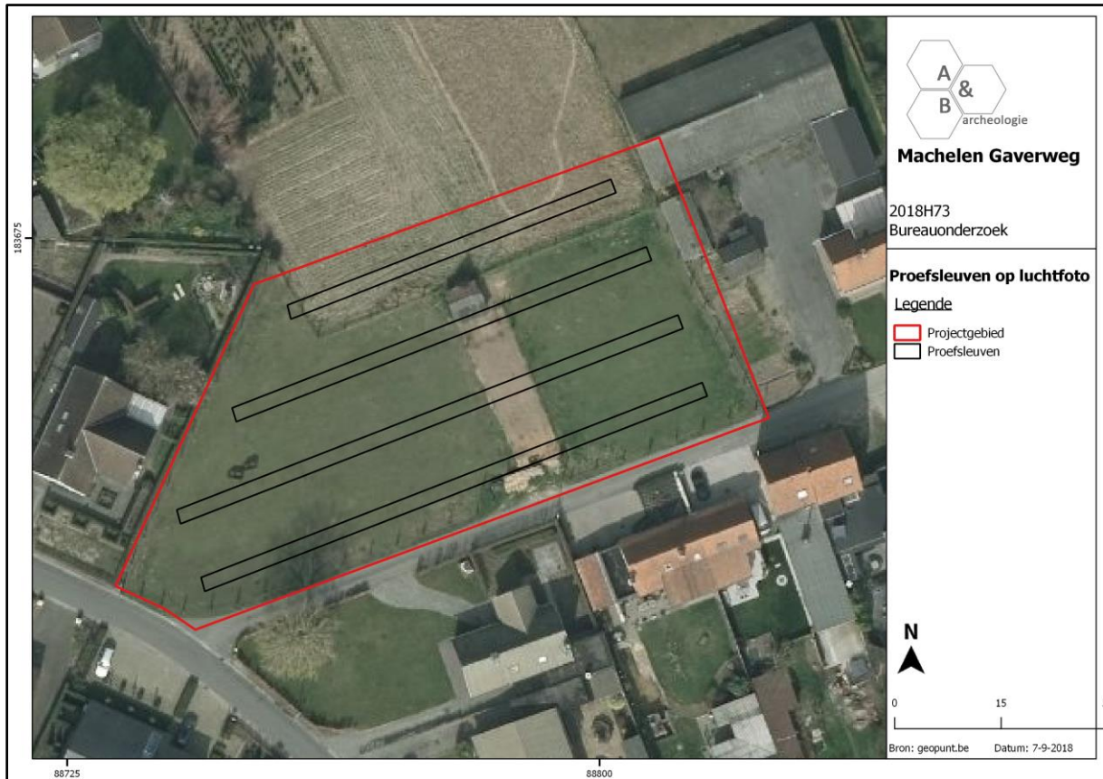
Figuur 3 Indicatief sleuvenplan, geprojecteerd op het luchtfoto.