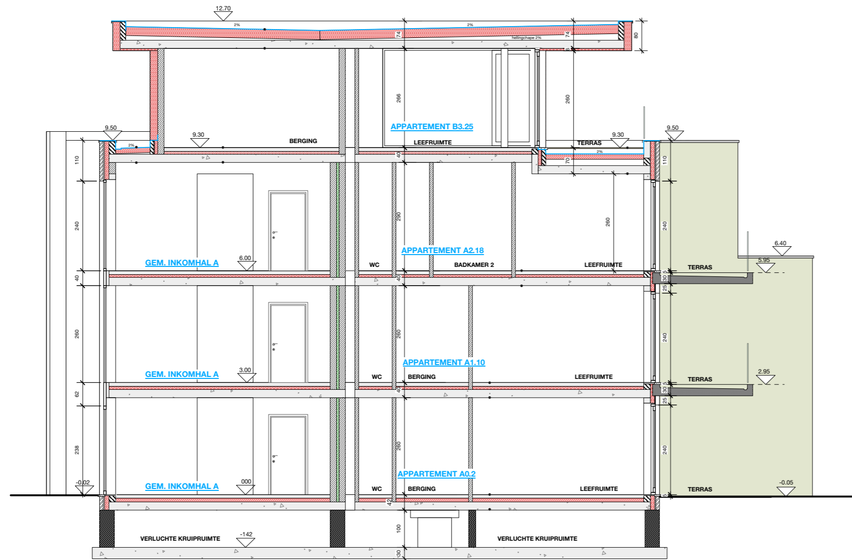
Doorsnede CC schaal 1/100