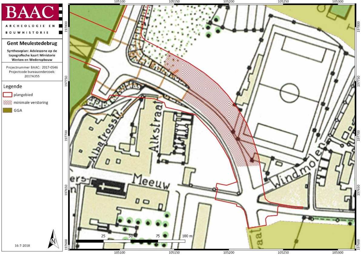
Plan 2: Advieszone op de Topografische kaart van het Ministerie Werken en Wederopbouw (1950-1970) (1:10.000; digitaal; 16072018)