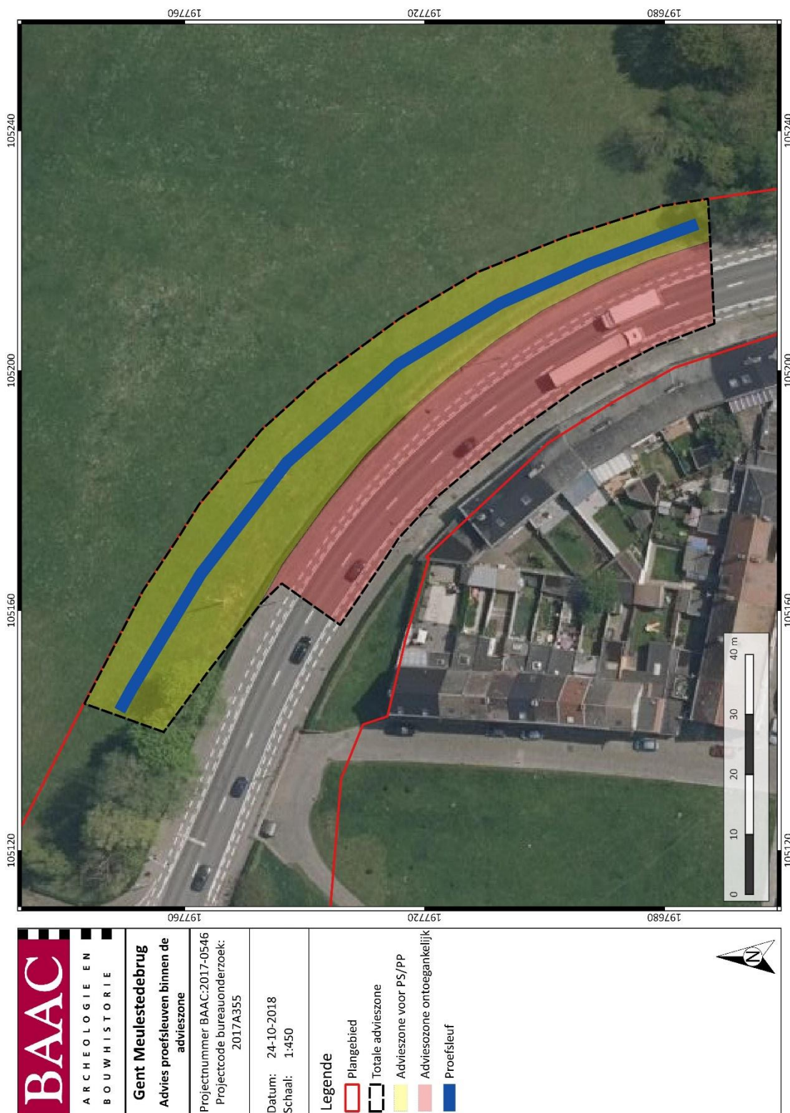
Plan 4: Voorstel proefsleuf binnen advieszone op de meest recente orthofoto (1:1; digitaal; 17072018)

onder de bestaande New-Orleansstraat. Het aanleggen van kijkvensters, of meer bepaald verbredingen van de werkput, is mogelijk over quasi de volledige lengte van de proefsleuf. Dit echter enkel binnen de groenzone.