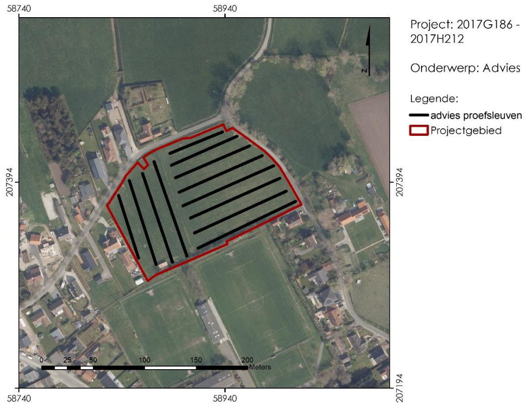
Figuur 3. Richtinggevende inplanting van de geadviseerde proefsleuven t.o.v. een recente orthofoto van het gebied.