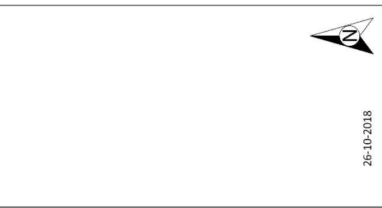
Figuur 1: Inplanting landschappelijke boringen