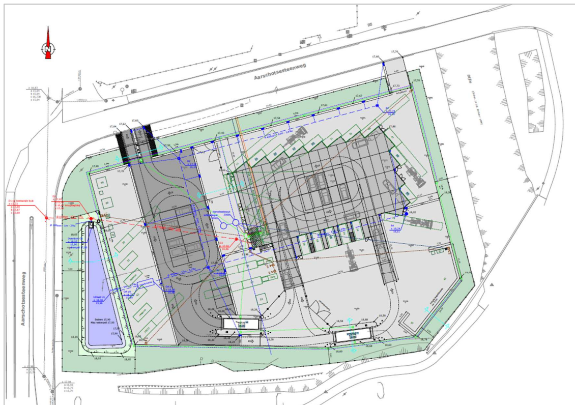
Figuur 2: Toekomstplan (InterLeuven, 2018).

Naar aanleiding van een aanvraag voor een omgevingsvergunning heeft ARCHEBO bvba een archeologienota opgemaakt voor een projectgebied gelegen tussen de rivier de Dijle, de Aarschotsesteenweg en de spoorweg Leuven-Brussel. Op het projectgebied wordt de aanleg van een recyclagepark gepland. Hierbij wordt nagenoeg het gehele terrein afgegraven en geasfalteerd of gebetonneerd en gefundeerd met 60cm steenpuin.