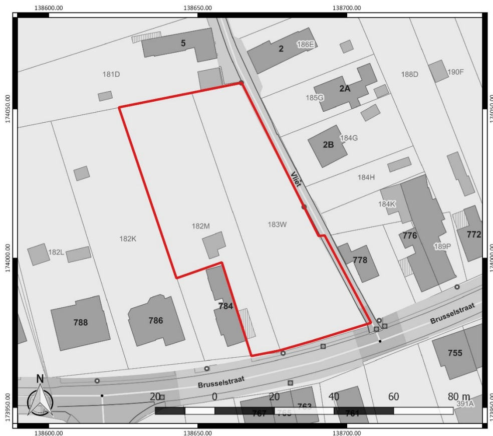
Figuur 1: Kadasterplan met aanduiding van het onderzoeksgebied in rood ( www.geopunt.be )