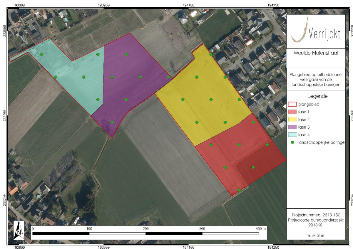
Figuur 2: Inplanting landschappelijke boringen