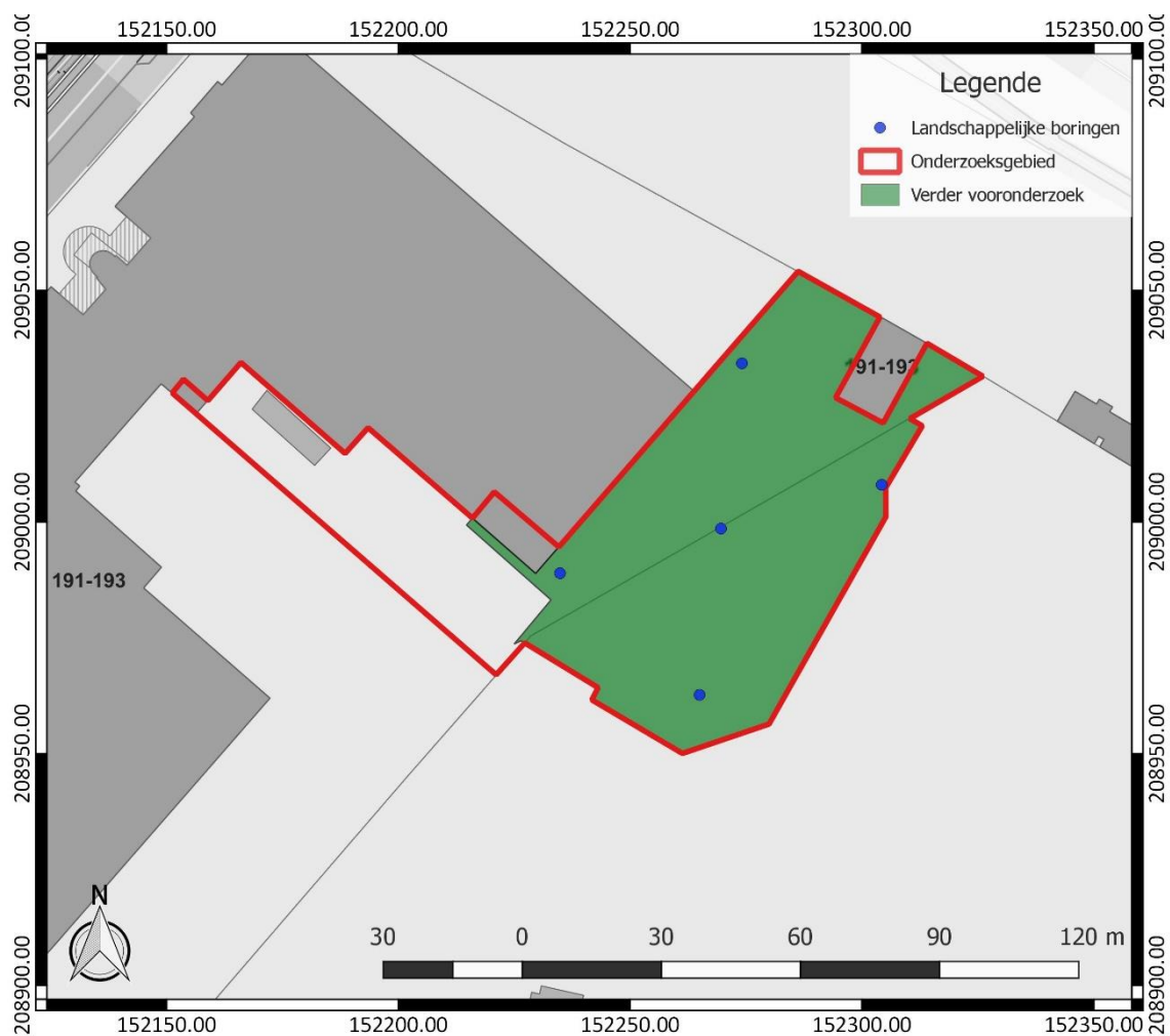
Figuur 3: Inplanting van de landschappelijke boringen (blauw), binnen het onderzoeksgebied (rood), weergegeven op het GRB ( www.geopunt.be )

Voor de gehanteerde onderzoekstechnieken is hoofdstuk 7.3 van de Code van Goede Praktijk van toepassing. De boringen worden gezet volgens een verspringend driehoeksgrid van 30 x 40 m, waarbij 30 m de afstand is tussen de raaien en 40 m de afstand tussen de boringen op een raai. De boringen worden gezet met een Edelmanboor van 7 cm in diameter. Dit volstaat om een beeld te krijgen van de bodemopbouw binnen het onderzoeksgebied en de mogelijke landschappelijke verschillen op microschaal.