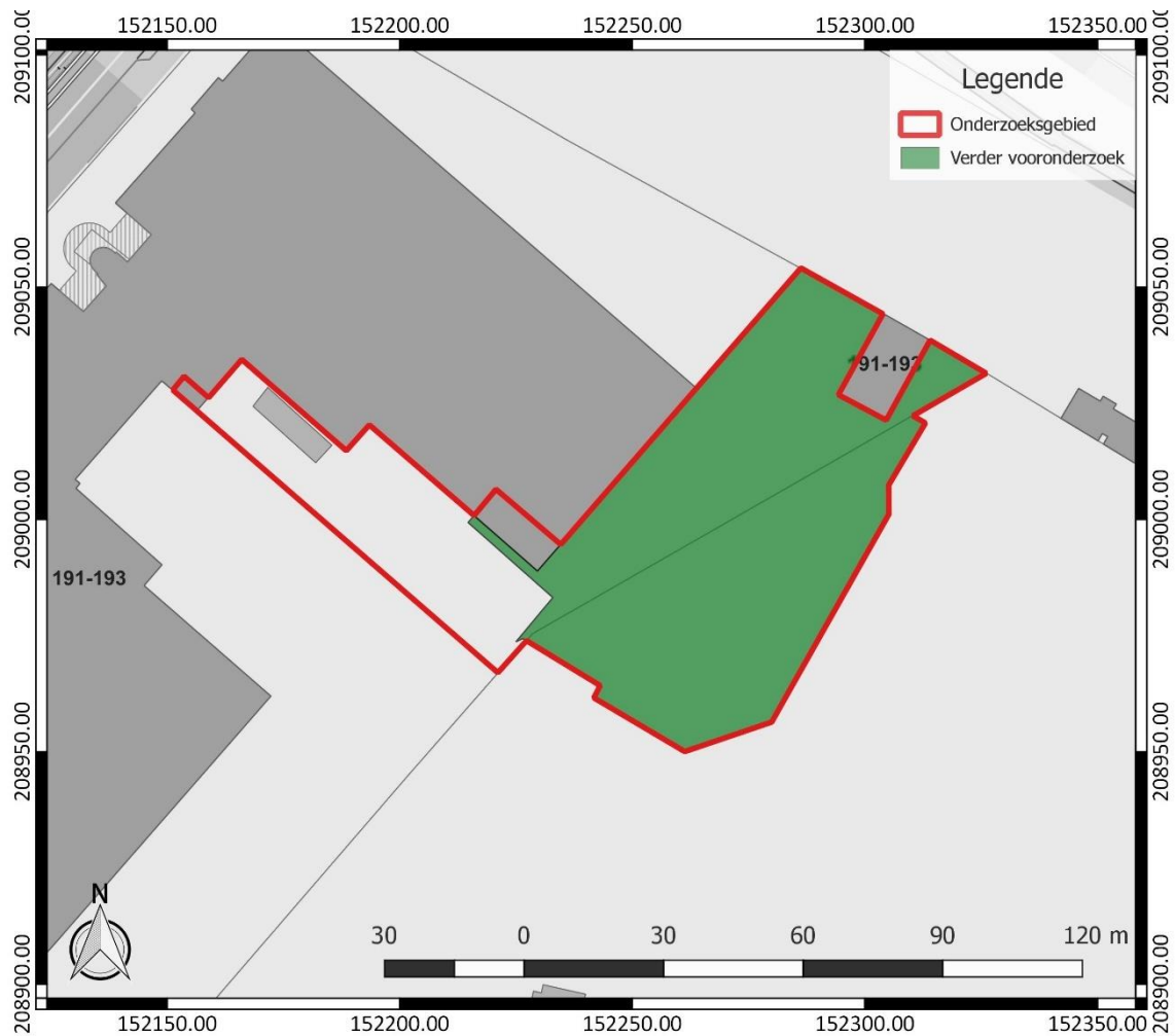
Figuur 2: Zone afgebakend voor verder vooronderzoek, weergegeven op het GRB ( www.geopunt.be )

De onderzoeksdoelen zijn succesvol bereikt wanneer de vooropgestelde onderzoeksvragen en de bijkomende onderzoeksvragen die opgesteld worden naar aanleiding van elk assessment beantwoord zijn.