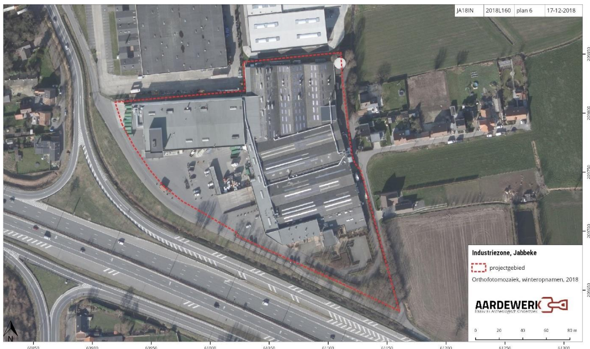
Figuur 1: Het projectgebied pop de orthofoto uit 2018 (agiv)

Mercator Press n.v. plant de sloop van twee loodsen en de bouw van twee nieuwe loodsen op dezelfde locatie. Daarnaast is een nieuwe betonnen overkapping gepland. De werken situeren zich op een bedrijventerrein langs de Industriezone in Jabbeke. De oppervlakte van de geplande werken bedraagt 6.748 m 2 en de oppervlakte van het perceel is 2,67 ha. Om de mogelijke aantasting van het bodemarchief op deze terreinen in te schatten werkt Mercator Press n.v. samen met Aardewerk, Raakvlak Archeologisch Onderzoek. Doel van de opdracht is het waarderen van het terrein aan de hand van een bureauonderzoek . Dit onderzoek resulteert in een archeologienota.