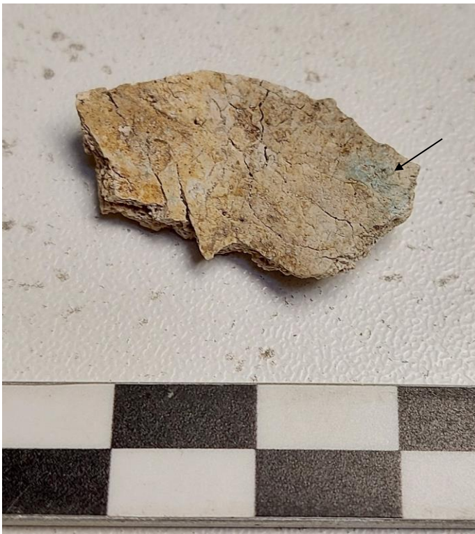
Figuur 4: Groene verkleuring op een schedelfragment.

Op twee botfragmenten zijn groene verkleuringen aangetroffen (fig. 4). Deze verkleuringen zijn vermoedelijk ontstaan als gevolg van een koperen of bronzen voorwerp welke bij de crematieresten in de grond moet hebben gelegen. Er is geen dierlijk botmateriaal aangetroffen in de crematie.