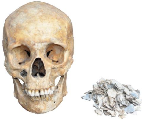
Figuur 1: Een onverbrande schedel naast alles wat over is van een verbrande schedel.

Na de verbranding wordt het botmateriaal verzameld en gedeponerd. De brandstapel kan worden geblust als men vindt dat het lichaam voldoende verbrand is. Maar men kan ook wachten tot de brandstapel volledig opgebrand is. Bij het blussen ontstaat daardoor een temperatuurverschil. Dit leidt ertoe dat het botmateriaal nog meer scheuren gaat vertonen. Het materiaal zal dus nog makkelijker fragmenteren.