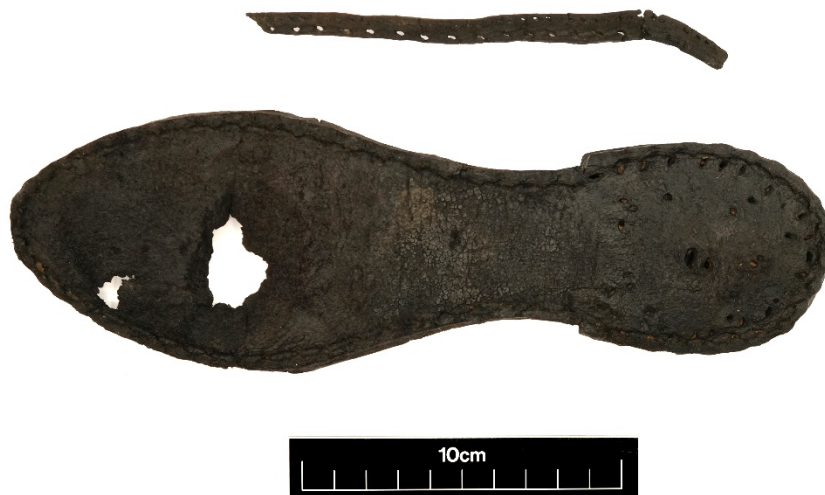
Figuur 6: Binnenzool (233:001) en randfragment (233:002).

vondst bevestigd is aan het bovenleer en andere zoollagen van de schoen of laars met een rand rond de voorkant en een gevouwen rand rond de hiel. Het aanwezige randfragment past echter niet op het binnenzool en lijkt onderdeel te zijn van een meer delicate schoen dan de vrij zware binnenzool (6,4 mm dik). De rand wijst op een algemene datering na 1500 (Goubitz 2001, 79), de vorm van de binnenzool helpt om deze datering te verfijnen. Met de ovale neus en duidelijke afbakening van de hak duiden dit op een datering vanaf 1720/1730 toen een ovale neus opnieuw in de mode raakte na een periode waarvan een rechthoekige neus in de mode was (Swann 1982, 25-26; 2001, 161-162). Verder, de vorm van de zool maakt geen verschil tussen links en rechts. Hierdoor kan de datering van de zool niet later dan het begin van de 19 e eeuw zijn, wanneer dit verschil opnieuw verschijnt (Swann 1984, 32; Swann 2001, 183). Omdat de binnenzool vrij dik is, is het mogelijk dat het onderdeel van een laars was. Het gebrek van een sterke boog van het leer suggereert dat het geen hoge hak had.