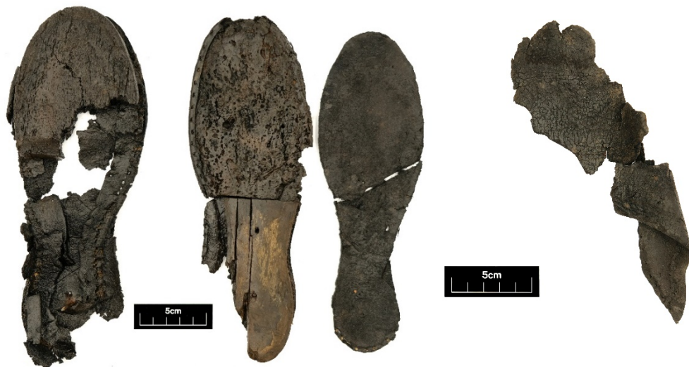
Figuur 1: Rechts: Zoollagen van een paarmuil (geul:001-002). Links: De twee grootse fragmenten van de kap van geul:001

18 van de fragmenten zijn de onderdelen van een muil, gemaakt van rundleer (geul:001). Muilen kunnen gedragen zijn als overschoenen om schoenen te beschermen tegen vuil en slijtage, maar net voor de zeventiende eeuw werden muilen ook gedragen als een primaire vorm van schoeisel (Goubitz 2001, 243). Van de constructie zijn de binnenzool, 23,7 cm lang (maat 35.5), enveloppe, de tussenzool gemaakt van kurk op de voorkant (0,9 cm hoog) en hout op de achterkant (2,1 cm hoog), buitenzool, en negen fragmenten van het kap aanwezig. Daarnaast zijn nog drie fragmenten genaaid en bevestigd aan de buitenzool door middel van houten pennetjes. Mogelijk zijn deze fragmenten toegevoegd als deel van een reparatie van de zoollagen, maar kunnen ook onderdeel zijn van de oorspronkelijke constructie als versteviging van de voorkant van de schoen. Extra gaten op overige delen van de buitenzool suggereren dat de muil op een gegeven moment wel is gerepareerd. Terwijl de kap in meerdere delen is, is het nog mogelijk om te zien dat de kap schuiner is tot bijna de hiel van de voet (vleugelkap). Op de binnenkant van het kap zijn stikselsporen voor een verstevigingskoord. Een deel van de kap is weggesneden, mogelijk is dit gedaan om het instapopening groter te maken of het leer te hergebruiken, mogelijk als onderdeel van een reparatie.