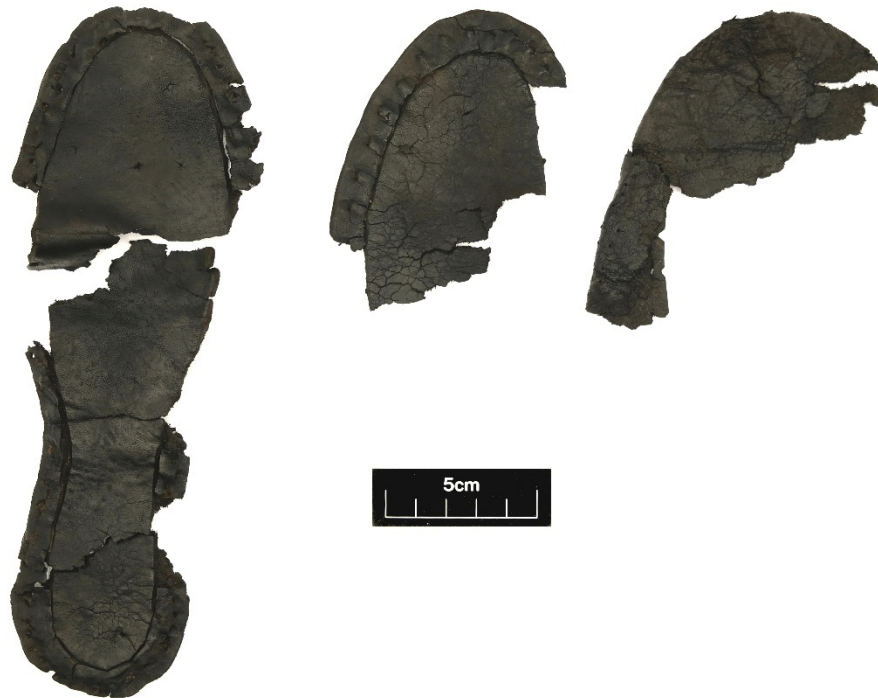
Figuur 3 Zolen en bovenleer fragmenten van een mogelijk paar instapschoenen (geul:003-004).

stikselsporen die geen onderdeel van een reparatie lijken te zijn, mogelijk is iets aan het leer toegevoegd als deel van een versiering van het bovenleer. Extra stikselsporen op de meer complete zool wijzen erop dat een reparatie van tenminste een van de zolen uitgevoerd is.